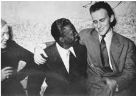
Miles Davis y Boris Vian, 1950

dad, potente y agresiva, y por su gran versatilidad estilística.