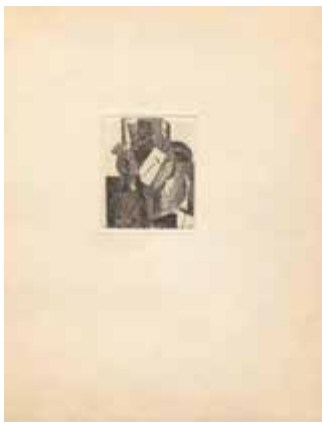
Aguafuerte de Pablo Picasso Homme au chapeau (“Hombre con sombrero”, 1914) en Albert Gleizes y Jean Metzinger, Du cubisme, París: Compagnie Française des Arts Graphiques, 1947

mo; y por último, porque creían que debían ser ellos, los pintores, y no los teóricos, quienes tratasen de explicarlo. Se trata de seis aguafuertes, tres puntas secas y dos aguatinas. Los grabados de esta edición se prepararon durante los años veinte, pero no se estamparon y publicaron hasta 1947. Así, por ejemplo, la plancha de Homme au chapeau (“Hombre con sombrero”) la había realizado Picasso entre 1914 y 1915, aunque no fue estampada hasta 1947 para su publicación en esta edición.