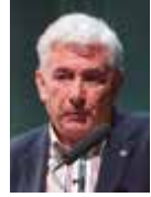
Miguel Ángel Puig-Samper