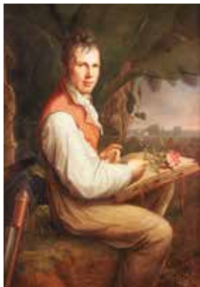
Alexander von Humboldt, retratado por Friedrich Georg Weitsch, 1806