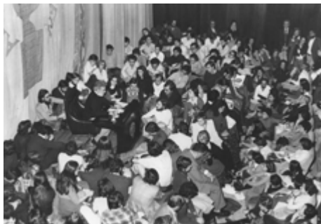
Conferencia sobre Sigmund Freud de Carlos Castilla del Pino, 14 de octubre de 1976

la creación mediante programas de becas, ayudas y operaciones especiales en España y en el extranjero, primeros seminarios y conciertos en diferentes lugares de España.