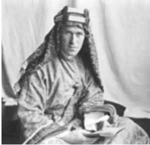
Lawrence de Arabia