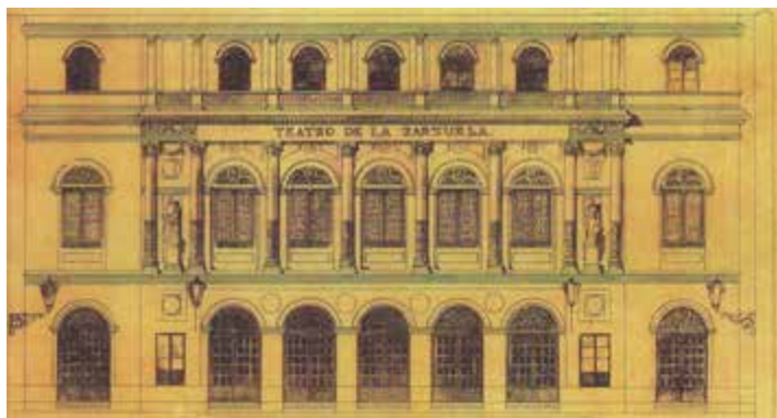
El Teatro de la Zarzuela, inaugurado en 1856.

Teatro Variedades una nueva modalidad, consistente en ofrecer una sesión continua de obras breves en un acto, que no sobrepasaran la hora de duración, de modo que se representaban varias obras en cuatro horas consecutivas, con entrada independiente para cada una. Su bajo precio y la flexibilidad de los horarios contribuyeron a captar al público madrileño de la época.