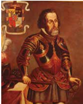
Hernán Cortés, retrato anónimo del siglo XVI

“ Hernán Cortés es un personaje muy controvertido, sobre el que se han vertido los juicios más opuestos. De ahí que sea preciso un análisis muy riguroso que dé cuenta puntual de las cuestiones más conflictivas y debatidas. Tras hablar de su formación, hay que dilucidar su actitud para con el gobernador Diego Velázquez, las sucesivas etapas de su conquista de México, las relaciones con Moctezuma y Cuauhtémoc, la forma-