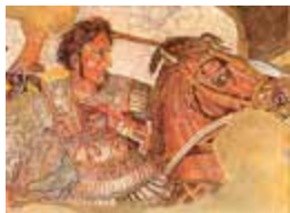
Alejandro Magno combate contra el rey persa Darío III en la batalla de Issos. Detalle de mosaico, c. 325 a.C. Museo Arqueológico Nacional de Nápoles

“ Alejandro Magno aunaba, en la campaña asiática que heredó de su padre Filipo II, varios intereses. Junto con el diseño político, Alejandro tuvo también una enorme curiosidad intelectual fruto de la formación que recibió de Aristóteles. Eso explica que, vencidos sus principales enemigos, pretendiese continuar su expedición en buena parte para confirmar