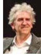
Juan Luis Arsuaga