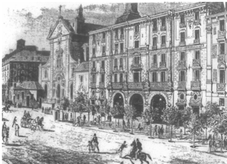
El Teatro Apolo, en la calle de Alcalá, fue conocido como "la catedral del género chico".

Al contrario, entre el público del Liceo predominaban las ideas más liberales, propias de los nuevos ricos procedentes de la industria y del comercio. En la década del cincuenta y hasta su incendio en 1861, la gestión económica del Liceo no fue empresa fácil, hasta el punto de que durante sus catorce primeros años fue administrado por catorce empresas, debido a que desde la designación del empresario hasta los precios y los espectáculos que se representasen dependían de la aprobación de la junta de propietarios, con el fin de que los accionistas no resultaran perjudicados. La difícil actitud del público fue también un factor determinante, ya que desde la inauguración del Teatro Real de Madrid se aficionó a establecer comparaciones peyorativas entre los estrenos de los dos teatros, ambos de munificencia real, a pesar de que el Liceo no recibía ninguna subvención.