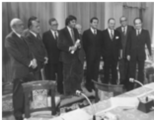
Firma de los Pactos de la Moncloa, 25 de octubre de 1977

Entre sus últimos libros se encuentran Atado y mal atado. El suicidio institucional del franquismo y el surgimiento de la democracia y La impotencia democrática. Sobre la crisis política de España . Es colaborador habitual del diario El País . ♦