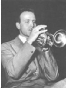
Boris Vian en Saint-Germain-des-Prés, París

Este ciclo pasa revista a la poliédrica relación de Boris Vian con el jazz desde distintos ángulos: un concierto con chansons compuestas y escritas por Vian, otro con el repertorio que gustaba de interpretar como trompetista y un tercero centrado en la figura de Miles Davis, a quien el novelista dedicó sus elogios en numerosas críticas.