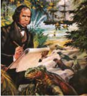
Charles Darwin en las islas Galápagos, por Charles Howat.