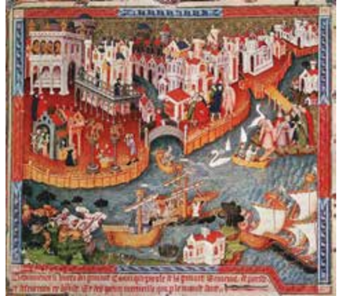
Marco Polo saliendo de Venecia en 1271. Manuscrito del siglo XV. Colección de la Biblioteca Bodleiana, Oxford

ción y administración de sus dominios, la caracterización de su corte de Cuernavaca o su implicación en la empresa del Mar del Sur. Y hay que discutir la vital disyuntiva de su acción como enemigo de una América y enamorado de otra, como destructor de un mundo y constructor de otro.”