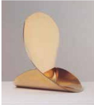
Max Bill, Superficie hexagonal en el espacio en el perímetro íntegro de la circunferencia, 1953-1960. Kunstmuseum Winterthur