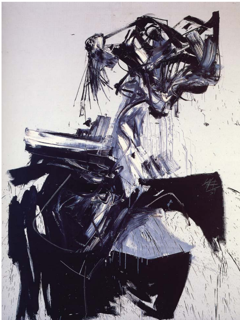
Brigitte Bardot, 1959