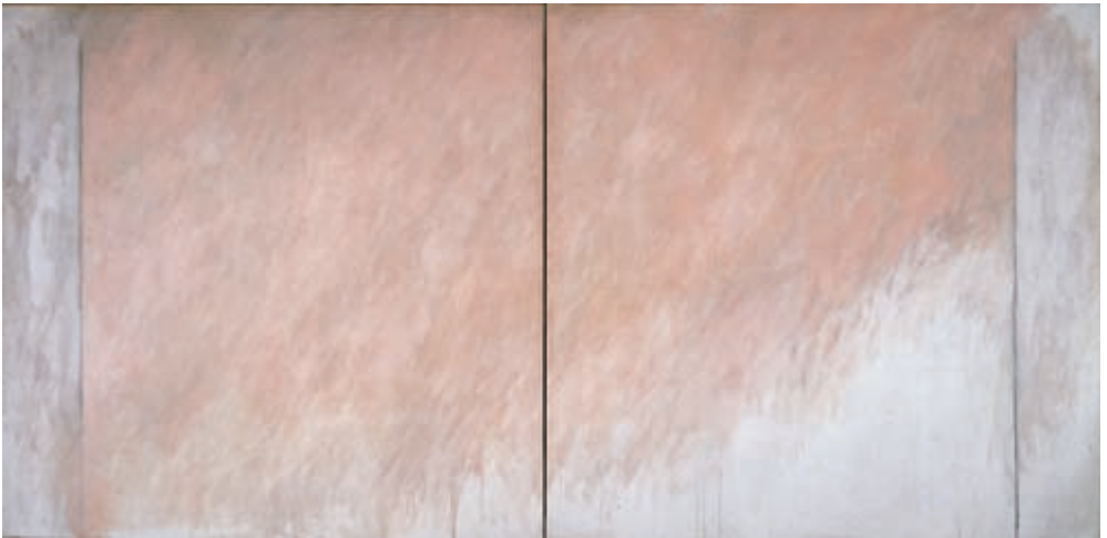
Rosa y naranja, 1976