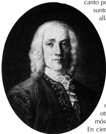
Retrato de Domenico Scarlatti. Litografía de Alfred Lemoine a partir del retrato al óleo de Antonio de Velasco, actualmente en la Casa dos Patudos - Museu de Alpiarça, Portugal (en Amédée Méreaux, Histoire du clavecin , Paris au Mènestrel, Heugel & C.ie, 1867).

canto popular, resulta fácil afirmar que el ilustre y presunto «discípulo» supo llevar el juego mucho más allá de las alusiones que le insinuara el «maestro».