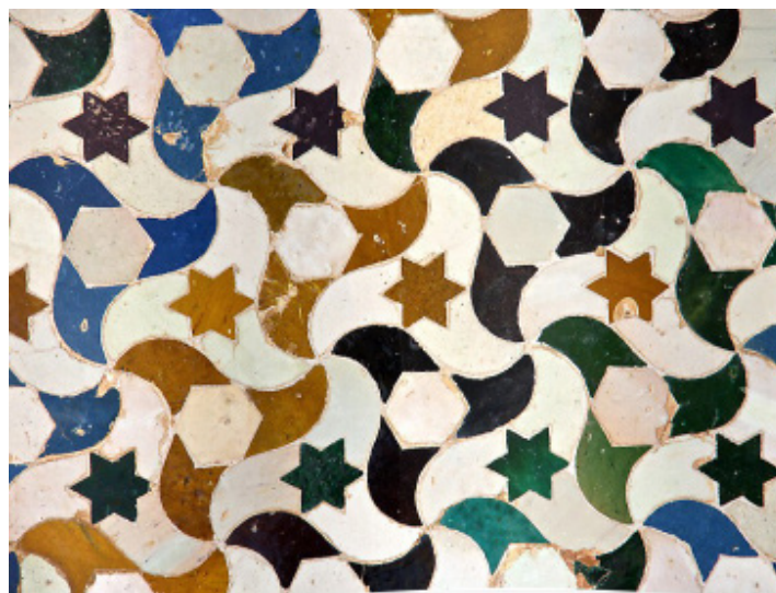
Azulejos de la Alhambra de Granada

Escuchar Isaac Albéniz: Azulejos (1909) , completada por Enrique Granados en https://www.youtube.com/watch?v=UymneP83Esw