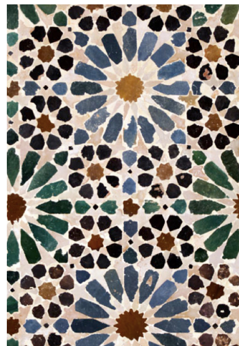
Panel alicatado nazarí, Museo de la Alhambra