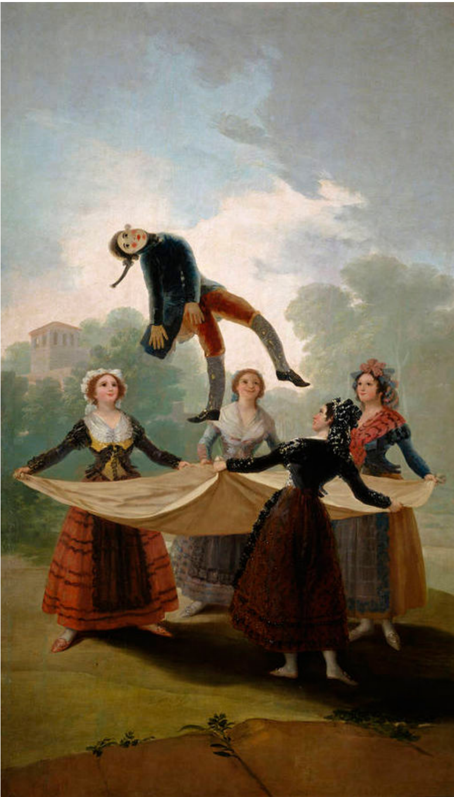
El pelele por Goya, 1791-92

Ahora que ya sabes en qué consiste la costumbre de mantear un pelele, intenta recordar cómo se denominaba a las mujeres en la época de Goya. Indica también a quién representa el pelele.