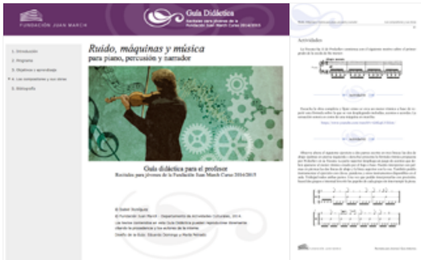
Imagen 2. Guía didáctica de Ruido, máquinas y música . Temporada 2014-2015