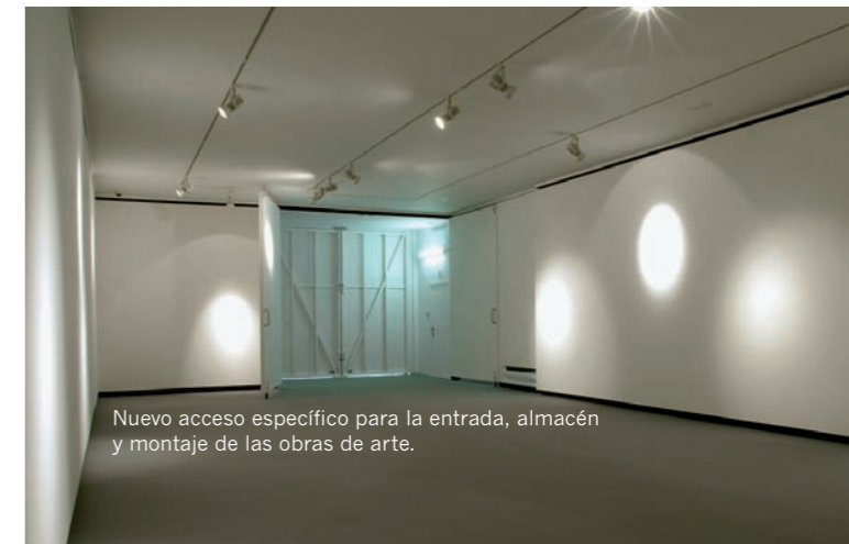
Nuevo acceso específico para la entrada, almacén y montaje de las obras de arte.

Se ha actualizado y mejorado notablemente el sistema de climatización. Los nuevos equipos controlan cualquier variación en la temperatura y la humedad relativa de la sala. Asimismo, se ha sustituido el anterior sistema de iluminación por equipos más actualizados y polivalentes, dotados de proyectores con filtros y reguladores de intensidad individualizados. Un suelo sintético, de reciente aparición en el mercado, de suave textura y fácil mantenimiento, sustituye a la antigua moqueta en la sala de exposición, en continuidad cromática con el nuevo solado –de granito oscuro– del hall de la Fundación.