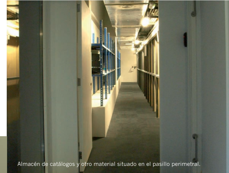
Almacén de catálogos y otro material situado en el pasillo perimetral.

El proyecto de los arquitectos ha atendido a la reordenación de los flujos de personas y a la racionalización de los servicios al público. El hall de entrada a la Fundación presenta un nuevo punto de información, recepción y atención al público, situado ahora en el centro del vestíbulo para mayor comodidad de los visitantes de las exposiciones, los asistentes a los actos que se celebran en los auditorios de la planta -1 (donde está también la cafetería) y de quienes se dirigen a las distintas dependencias de la Fundación.