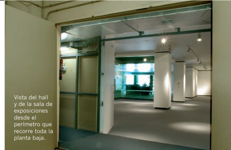
Vista del hall y de la sala de exposiciones desde el perímetro que recorre toda la planta baja.

en forma de “L” invertida se han convertido en una gran “U” invertida, divisible, con entrada y salida independiente, y que puede acoger hasta dos exposiciones simultáneamente. Permite, además, exponer obras de mayor formato y organizar el espacio con una mayor versatilidad y mejores resultados estéticos y prácticos.