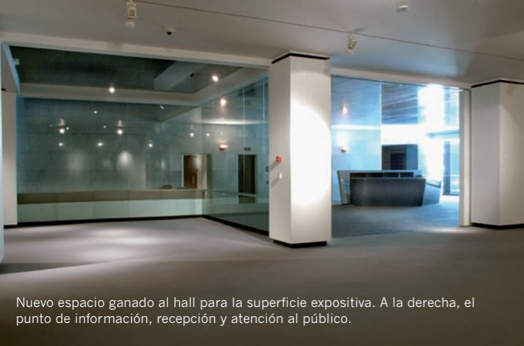
Nuevo espacio ganado al hall para la superficie expositiva. A la derecha, el punto de información, recepción y atención al público.

Las nuevas salas de exposiciones quedan ahora más protegidas de las oscilaciones de temperatura y corrientes de aire provenientes del exterior, lo que refuerza la seguridad de las obras de arte. Se han creado nuevos accesos, específicos para las obras de arte, así como un almacén de montaje directamente conectado con la sala y con las mismas condiciones de climatización que ésta. En un perímetro de 1,50 metros de ancho, que recorre toda la planta baja, se concentran las funciones de almacenamiento, conducciones y equipamientos de climatización, electricidad y seguridad que permiten intervenir mejor en la estructura de las paredes de la sala.