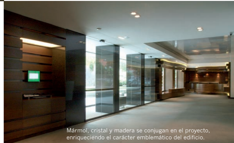
Mármol, cristal y madera se conjugan en el proyecto, enriqueciendo el carácter emblemático del edificio.

La superficie de la zona expositiva ha aumentado en un 30%, y en más de un 40% lo han hecho los metros lineales de cuelgue; y se ha ganado en altura (hasta 3,30 metros) al eliminar el falso techo por el que discurrían diversos equipamientos (electricidad y seguridad).