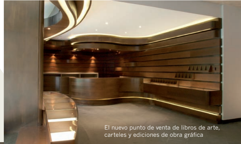
El nuevo punto de venta de libros de arte, carteles y ediciones de obra gráfica

y contundencia del edificio realizado por Picardo resultan realizadas con una mayor luminosidad y transparencia. El carácter emblemático que el edificio ha ido adquiriendo durante más de tres décadas se enriquece ahora gracias a un proyecto que conjuga el mármol, la madera y el cristal, e invita a entrar y a quedarse.