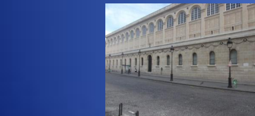
Colegio de Santa Bárbara