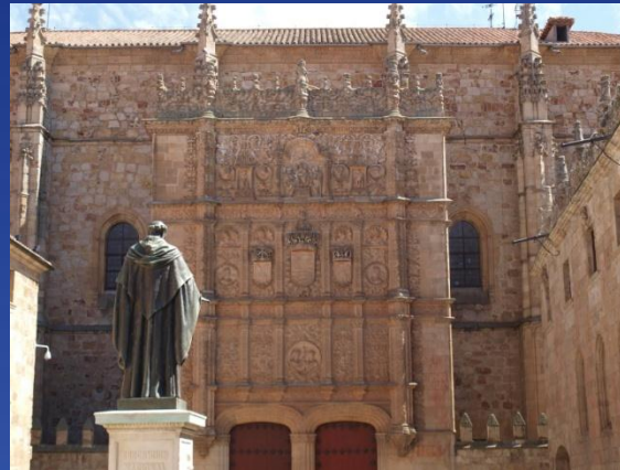
Universidad de Salamanca