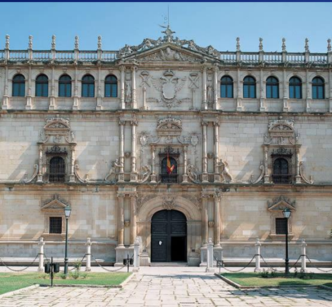
Universidad de Alcalá