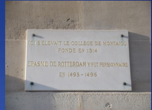
Colegio de Monteagudo