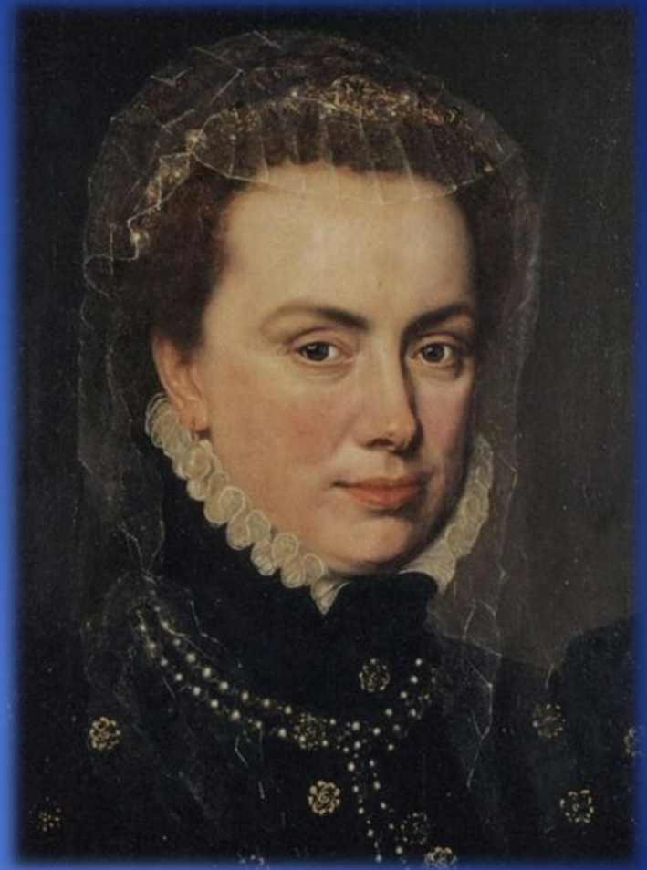
Margarita de Austria