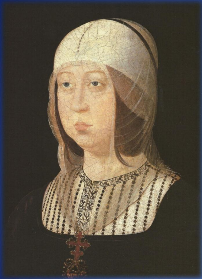
Isabel la Católica