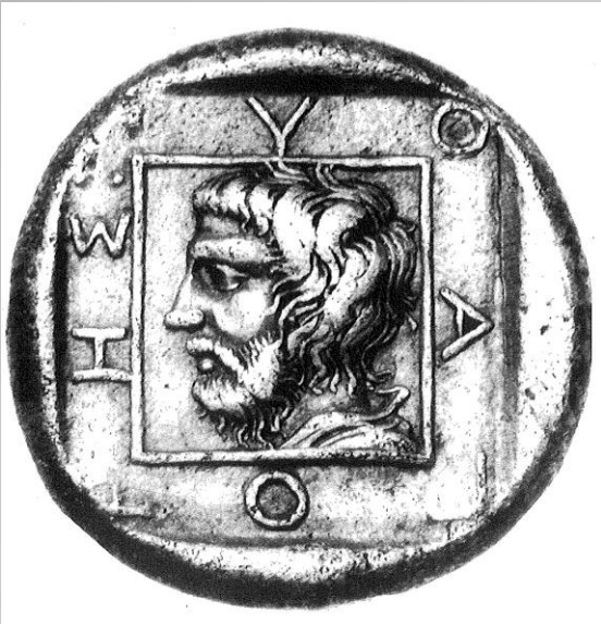
Moneda de Abdera (430-425 a.C.)