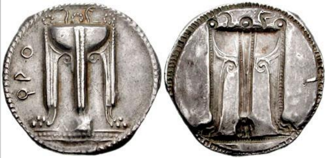
Estatera de Crotona con el trípode de Apolo (530-520 a.C.)