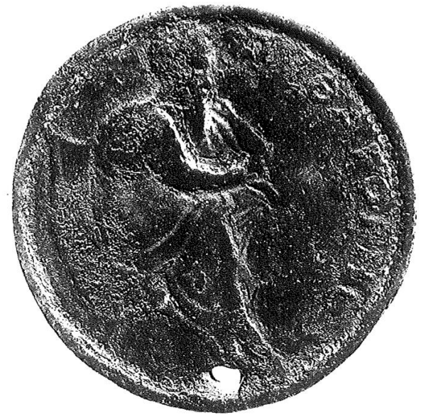
Moneda de Crotona (fecha desconocida)