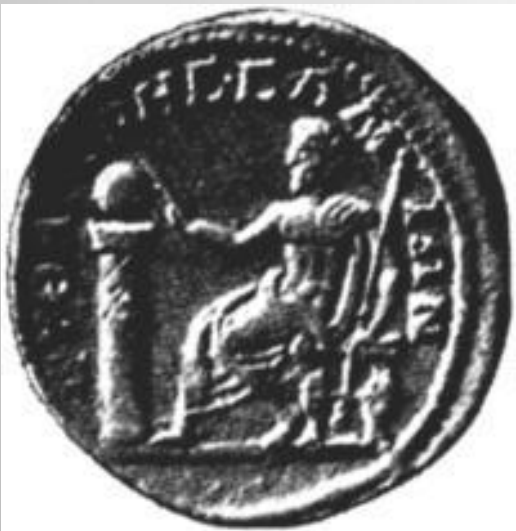
Moneda de Samos (s. III d.C.).