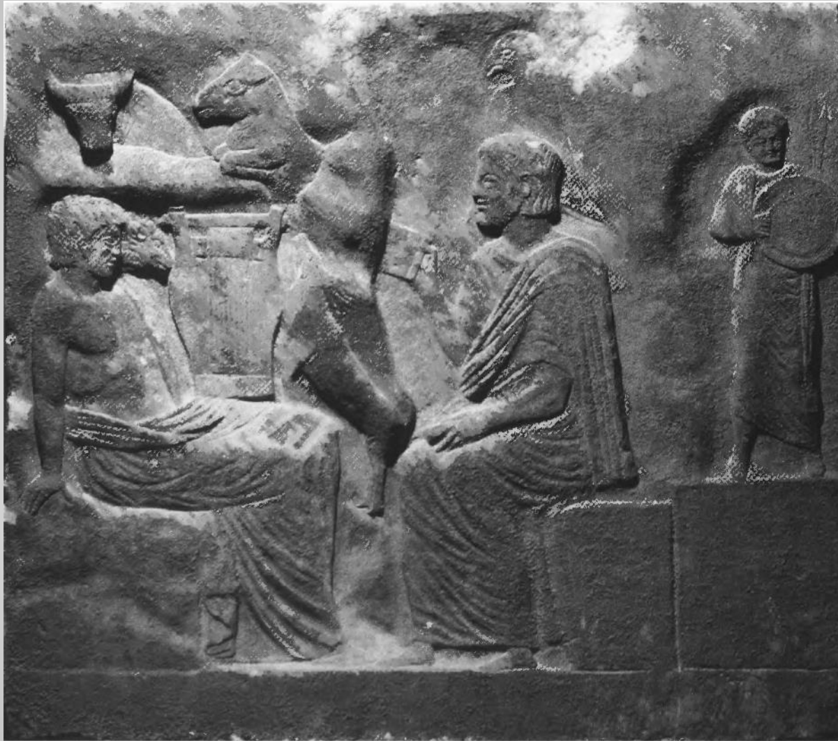
Relieve con Pitágoras y Orfeo. Museo de Esparta. Siglo IV a.C.