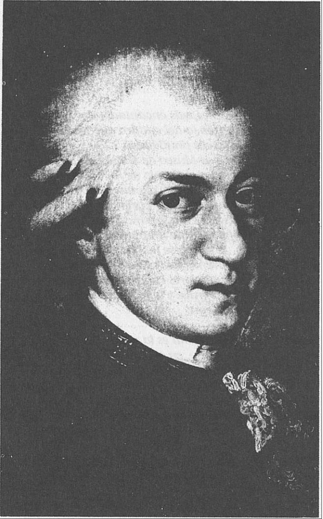
Mozart, a los veinliséis arios.