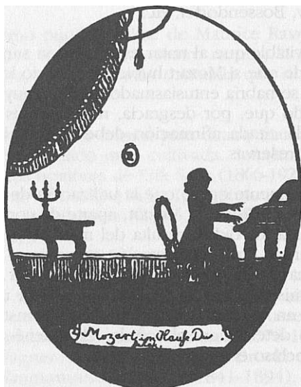
Mozart, en casa de los Duschek, en Praga.