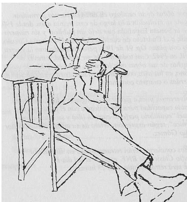
Turina visto por su hija Obdulia (1938).