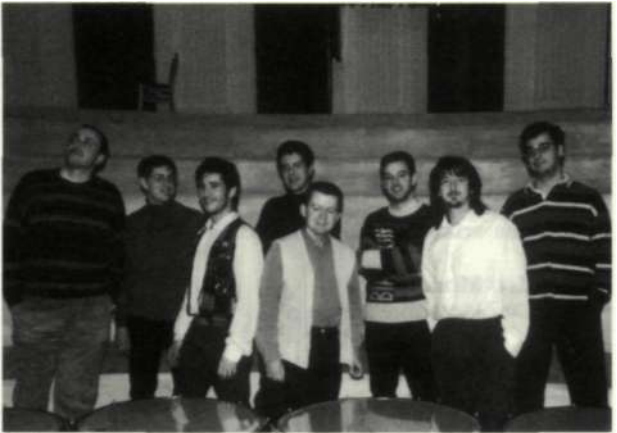
El Grupo Cosmos.