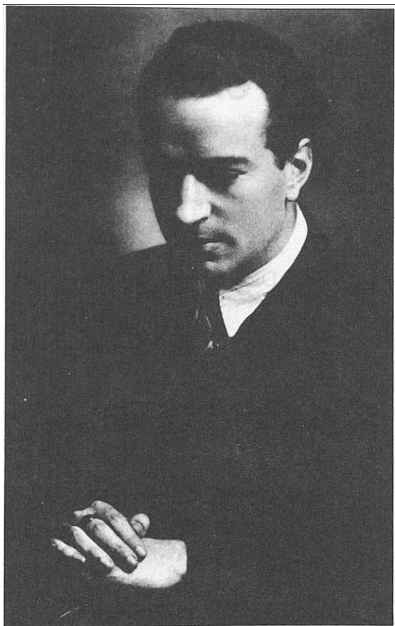
Joaquín Rodrigo en 1935 en Salzburgo.