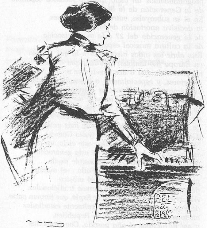
Muchacha al piano, dibujo de ñamón Casas.