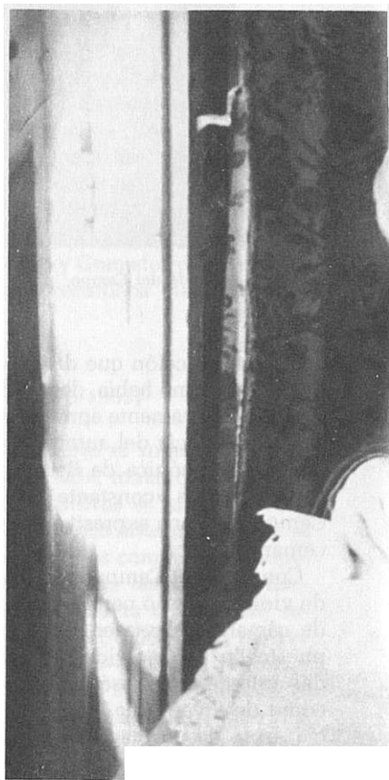
Ultima fotografía de Conrado del Campo.

Conrado del Campo fue maestro de composición de una serie de generaciones de las más diversas estéticas —Cristóbal Halffter fue uno de sus últimos discípulos— y enseñaba desde la juntura de vehemencia y