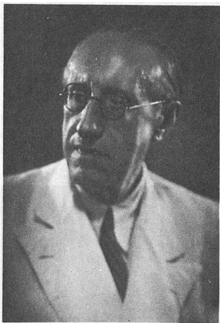
Conrado del Campo.

en la introducción que dentro del imposible/necesario del wagnerismo había, dentro de esa línea, un magisterio más directamente aprovechable: Strauss, propiciado por la presencia del autor en Madrid dirigiendo la Orquesta Filarmónica de Berlín. Esta dirección «poemática» será una «constante» en la obra de Conrado del Campo y da una expresiva singularidad a su música de cámara.