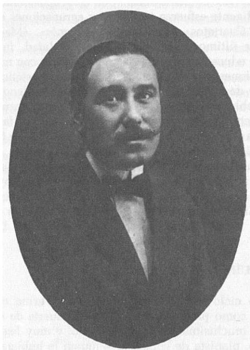
Joaquín Turina, en 1932.