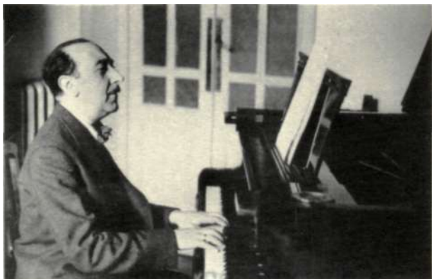
Jesús Guridi y su piano