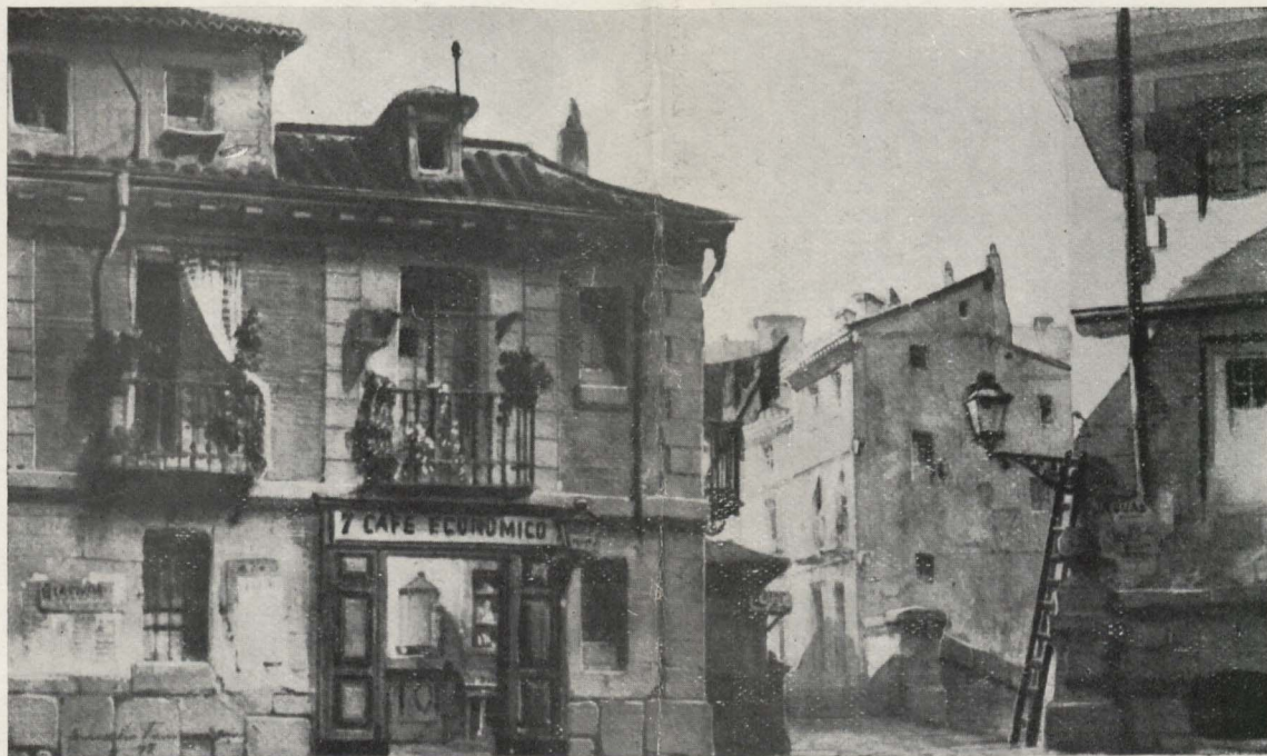
Boceto del Decorado del cuadro segundo de LA REVOLTOSA, Por Amalio González