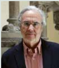
Manuel Gutiérrez Aragón