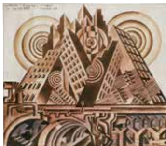
Fortunato Depero, Grattacieli e subway per The New Babel [Rascacielos y metro para La nueva Babel ], 1930. MART © Foto: MART, Archivo Fotografico © VEGAP, Madrid, 2014

trabajo artístico de Fortunato Depero entre 1913 y 1950. El catálogo, en su doble edición en español y en inglés, ha pretendido desde su concepción no sólo acompañar eficazmente a la exposición. Más allá –y a la vista de la práctica ausencia de monografías en español o inglés sobre el artista–, la publicación pretende ayudar en los trámites para que a Depero se le expida un “pasaporte” internacional del que inexplicablemente todavía carece, que permita que su obra se mueva con mayor comodidad por el canon del siglo XX y sea internacionalmente mejor conocida aún de lo que es hoy.