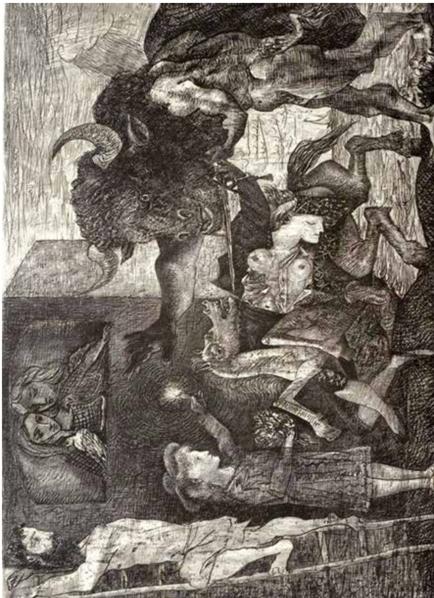
Minotauramaquia , 1935

Cobre (495 x 697 mm) estampado sobre papel. Aguafuerte, rascador y buril.