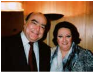
Lorenzo Palomo con Montserrat Caballé, a quien está dedicado el ciclo Del atardecer al alba ; y con los Alumnos de la Escuela Superior de Canto