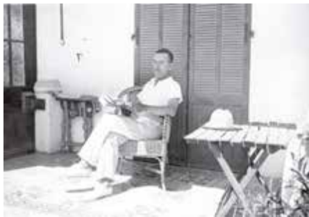
Thomas Mann en Sanary-sur-Mer, 1933

la Goethe-Gesellschaft, fue cofundadora y secretaria de la Sociedad Goethe de España entre 1999 y 2004. Ha traducido y editado la autobiografía de Goethe Poesía y verdad (1999), Conversaciones con Goethe (2006), de Johann Peter Eckermann, y Mozart de camino a Praga (2006) de Eduard Mörike. Como ensayista ha publicado el Diccionario crítico de mitos y símbolos del nazismo (2003), El misterioso caso alemán. Un intento