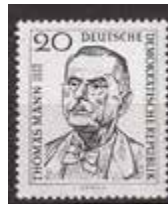
Sello de la República Democrática Alemana, 1956

Thomas Mann escritor se convirtió en un virtuoso del distanciamiento. A diferencia de la escritura a menudo fragmentaria y arrebatada de sus coetáneos expresionistas, la obra de Thomas Mann se construye a base de una férrea disciplina diaria, una capacidad de observación extraordinaria y una ironía perfectamente calibrada. Pertrechado con estas cualidades, Mann logró convertir en literatura