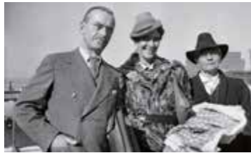
Thomas Mann, junto a su mujer y su hija, llegando a Nueva York, 1939.

Y sobre la segunda conferencia: “Al entender el arte como incompatible con la vida, el