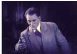
Fotograma de la película