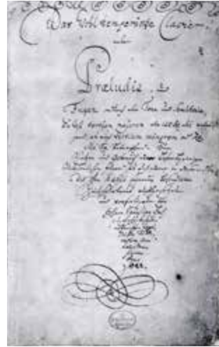
Portada de El clave bien temperado

que incluye autores infrecuentes como Solomon Jadassohn (maestro de Grieg, Busoni o Delius) y ejemplos inesperados de preludios y fugas compuestos por Ravel o Turina. César Franck y Karol Szymanowski completarán un programa que pondrá de manifiesto el vigor que, aun en tiempos de innovaciones, mantiene el feliz enlace preludeio-fuga.