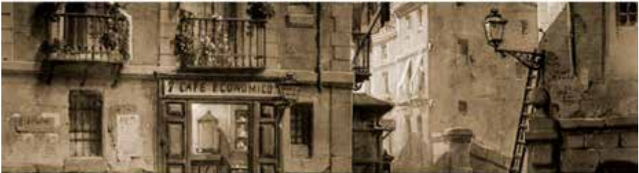
escenografía para el acto 2º de la zarzuela "La Revoltosa", Teatro de Apolo, 1897.