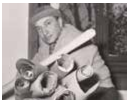
Depero en la casa de Viale dei Colli, Rovereto, 1956 (detalle).

El profesor Poldi ha examinado para su estudio más de una treintena de obras (diez pinturas, tres acuarelas, veintiséis dibujos y tres esculturas), algunas de las cuales se exhiben en la exposición, sometiéndolas a exhaustivos análisis con diversas técnicas. El seminario-taller consistió en una presentación y