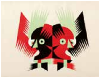
Fortunato Depero, Doppio ritratto di Marinetti [Doble retrato de Marinetti], 1923. Colección particular, Suiza

El director de Exposiciones de la Fundación Manuel Fontán escribe en el catálogo: “Fue un artista constructor de todo un universo futurista, un artista polifacético, multimedial, total y global: fue incansablemente pintor, escultor, dramaturgo y escenógrafo, escritor, poeta, ensayista, diseñador gráfico y publicitario, creador de arquitecturas tipográficas y pabellones de ferias, de libros, revistas y logotipos comerciales, creador de juguetes y tapices, empresario cultural –creador de uno de los primeros museos de artista del mundo, la Casa d’Arte Futurista en Rovereto– e inventor de uno de los primeros libros de artista de la historia, el célebre “libro atornillado” de 1927, el “museo portátil”. Depero fue y volvió una y otra vez sobre sus obras, experimentó con todos los géneros y soportes, inventó algunos y los mezcló todos: pintura, grabado, dibujo, escultura, tipografía, libros ilustrados, collages y fotocollages , escenografías y figurines y “conjuntos plásticos motorruidistas”; tablas onomalingüísticas y poesía parolibre y