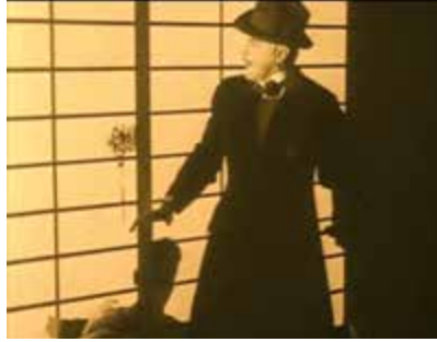
Fotograma de La marca del fuego

Román Gubern es el autor del texto general sobre el ciclo: “La Revolución Industrial impulsó el desarrollo de las grandes ciudades en el siglo XIX, en las que se agazapaba la delincuencia y el crimen y en cuyo contexto las relaciones humanas se despersonalizaron. En esta situación, en cada callejón podía asaltar el peligro y un vecino podía ser un criminal en potencia.