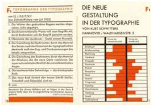
Kurt Schwitters, Die Neue Gestaltung in der Typographie [El nuevo diseño en la tipografía], 1930

Como es sabido, a lo largo de su carrera, para conseguir ingresos regulares, pintó también paisajes y bodegones de estilo tradicional –es decir, “arte” en un sentido premoderno–. De modo que puede decirse que su producción, tanto formal como económicamente, estuvo perfectamente bifurcada en dos actividades: aquellas con las que no ganaba dinero ( collages , objetos y construcciones escultóricas de vanguardia) y aquellas con las que sí obtenía ingresos (óleos y diseño gráfico). ♦