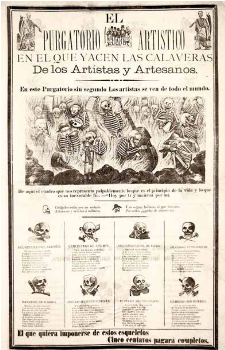
El purgatorio artístico en el que yacen las calaveras de los artistas y artesanos, c. 1909. Dibujado y grabado por José Guadalupe Posada. Imprenta de Antonio Vanegas Arroyo, calle de Santa Teresa número 1, Ciudad de México, c. 1909. Aguafuerte en relieve, texto tipográfico, 600 x 405 mm. Museo Nacional de la Estampa, México D.F.