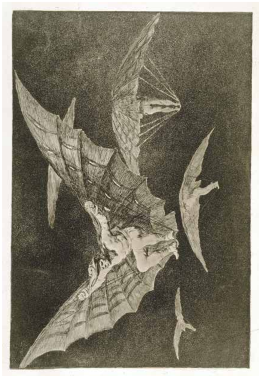
Modo de volar, de la serie los Disparates [13] inventado y grabado por Francisco de Goya. 245 x 358 mm. Grabado calcográfico (aguafuerte, aguainta y punta seca). Gabinete de dibujos y estampas. Museo Nacional del Prado. Go0749.