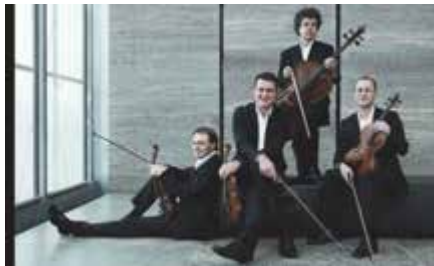
Cuarteto de Leipzig

En paralelo al adentramiento en las profundidades expresivas a través de su Quinta Sinfonía , Beethoven realizaba una aproximación