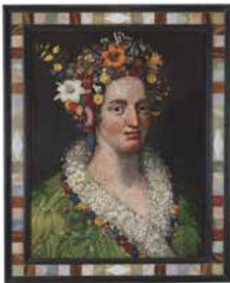
Flora , 1589

Flora y Flora meretrix , las obras que constituyen esta muestra, fueron celebradas en su momento como obras maestras, y son dos ejemplos de las llamadas teste composte , las características “cabezas compuestas” realizadas por Arcimboldo con el excepcional virtuosismo de un miniaturista que era, además, poseedor de un serio conocimiento científico de la flora y la fauna. El artista conforma ambas cabezas y bustos a base de flores, pequeños animales y otros elementos del mundo natural, elegidos con precisión y relacionados con el asunto a representar, pero únicamente reconocibles al contemplar de cerca las obras. Cada una de las “Floras” de la exposición representa una de las dos tradiciones clásicas que arrancan del mito de Cloris, quien, preñada por Céfiro,