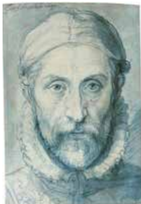
Autorretrato de G. Arcimboldo, 1571-76. Galería Nacional de Praga

Flora fue celebrada desde el momento de su realización como una de las obras maestras de Arcimboldo y, junto a Vertumno , fue la que más contribuyó a propagar su talento. Fue pintada en 1589, tras su definitivo regreso a Milán en 1587, y presentada a Rodolfo II el día de Año Nuevo de 1590, fecha en que era tradición hacer regalos al soberano. Flora es un magnífico ejemplo de la maestría de Arcimboldo en la representación de la naturaleza, pero también de su enorme curiosidad, habida cuenta de la gran variedad de flora representada. La diversidad de flores reproducidas por Arcimboldo dio como resultado una paleta cromática extraordinariamente sutil y variada que, además, está en el origen mismo del mito de Flora . Ovidio narra ( Fastos , V) la triste monocromía original de la Tierra, sólo animada por el color verde de las hojas y la hierba, hasta que Céfito, dios del viento, dejó preñada a Cloris, que, al transformarse en Flora, trajo al mundo la multitud de colores de las flores. Arcimboldo distribuyó las flores adecuándolas a