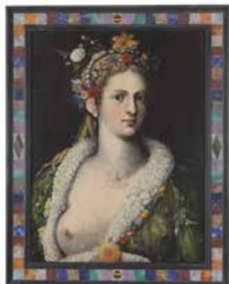
Flora meretrix , c. 1590

dios del viento, se transformó en la ninfa Flora y trajo el color a una tierra hasta entonces monocroma: las dos Floras son la ninfa Flora, representación de la primavera y alegoría de la concordia y la fecundidad natural, virtuosa y casta, y la Flora meretrix, mundana y sensual.