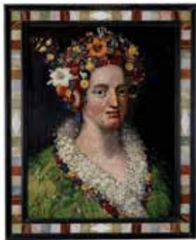
Flora (1589), de Giuseppe Arcimboldo Retrato de George Sand