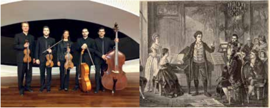
La Wiener Kammer-symphonie y recreación imaginada de Beethoven dirigiendo al Cuarteto Razumovsky, c. 1880

“Las reducciones instrumentales de música sinfónica nos ayudan hoy a descubrir la esencia, la sustancia más puramente musical de composiciones cuyo efecto expresivo aparece notablemente potenciado por los recursos de la gran orquesta. Así sucede en los arreglos para quinteto de cuerda de Carl Friedrich Ebers, que nos permitirán orillar el pathos que tanta relevancia tiene en estas obras, para atender a su proceso puramente musical.”