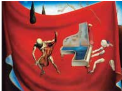
Salvador Dalí, La orquesta roja , 1957 Collection G.E.D: Nahmad, Geneve