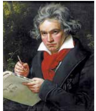
Joseph Karl Stieler: Retrato de Ludwig van Beethoven componiendo la Misa Solemnis , 1820. Bonn, Beethoven-Haus.

por Johann Nepomuk Hummel (1778-1837), con quien Beethoven mantendría discrepancias motivadas por su desacuerdo con algunas versiones camerísticas de sus sinfonías. Pero la pujanza de la industria editorial y la capacidad de los arreglos para difundir las creaciones musicales impulsarían a Beethoven a rea-