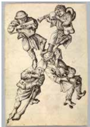
Maestro E. S., Letra X (músicos mendicantes) , c. 1435-67, Germanisches Nationalmuseum, Núremberg

Una selección de cerca de 200 dibujos, grabados, fotografías, libros y revistas exhibe la exposición Surrealistas antes del surrealismo , que presenta la Fundación Juan March en Madrid. Comisariada por Yasmin Doosry y organizada en colaboración con el Germanisches Nationalmuseum de Núremberg, la muestra abarca desde el Medievo tardío hasta el propio surrealismo del siglo XX.