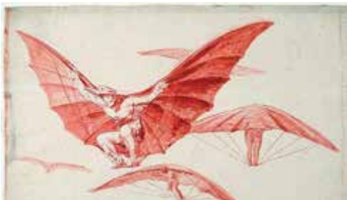
Francisco de Goya, Modo de volar . Dibujo preparatorio de la serie Disparates . Fundación Lázaro Galdiano, Madrid.

¿Qué conexión existe entre Man Ray y Alberto Durero? En este interrogante podría resumirse la cuestión que plantea esta muestra. La pregunta parece, en un primer momento, tan sorprendente como el “encuentro fortuito de una máquina de coser y un paraguas sobre una mesa de disección”. En 1920, antes de su llegada a París, el fotógrafo americano Man Ray creó L'Enigme d'Isidore Ducasse [El enigma de Isidore Ducasse]. En su principal obra literaria, Les Chants de Maldoror , del año 1868, Lautréamont (seudónimo de Isidore Ducasse) alababa la inusual belleza de un joven sirviéndose de una asombrosa comparación: “bello como el encuentro fortuito de una máquina de coser y un paraguas sobre una mesa de disección”. Esta metáfora absurda y contradictoria, que posee un matiz erótico, frío y distante, fue recibida por los surrealistas