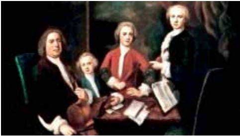
Johan Sebastian Bach con sus hijos Gottfried Heinrich, Carl Philipp Emmanuel y Wilhelm Friedemann (?) de artista desconocido.

MIEMBROS DE LA SAGA BACH CUYAS OBRAS SE INTERPRETAN EN ESTE CICLO: