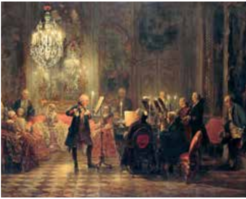
Carl Philipp Emanuel Bach con Federico el Grande. El concierto de flauta en Sanssouci , de Adolph von Menzel (óleo sobre lienzo, 1848). Alte Nationalgalerie, Berlín.