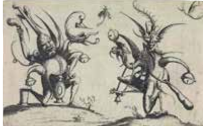
Pierre Jahan, Sin título, 1937 (Colección Dietmar Siegert) (izquierda) y Wendel Dietterlin el Joven, Figuras ornamentales fantásticas , 1615 (Germanisches Nationalmuseum, Núremberg)