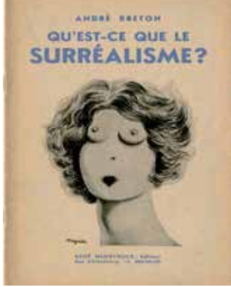
Portada del libro ¿Qué es el surrealismo? , de André Breton (1934)