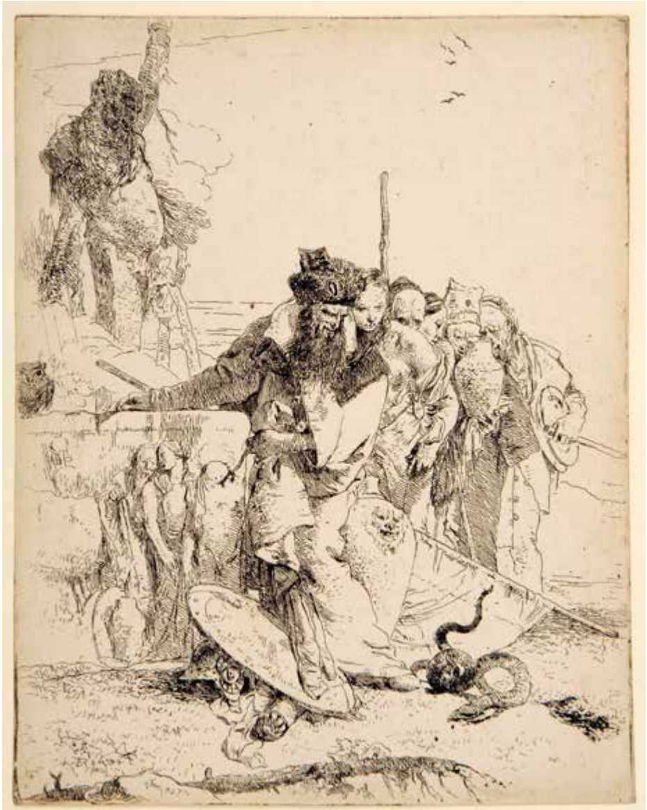
El mago y la serpiente , ca. 1743-50, de Giambattista Tiepolo. Grabado calcográfico, aguafuerte, 227 x 178 mm. Firmado sobre el cobre. En la esquina inferior izquierda de la estampa, invertido: Tiepolo. Harvard Art Museums / Fogg Museum, Loan from the Collection of Edouard Sandoz, 11.1965.