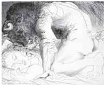
Minotauro acariciando a una mujer dormida, 1933

Fundación Juan March, Madrid 17 de julio - 31 de agosto 2013 Horario: de lunes a viernes, 11-20 horas. Sábados, 11-14 horas. Domingos y festivos, cerrado.