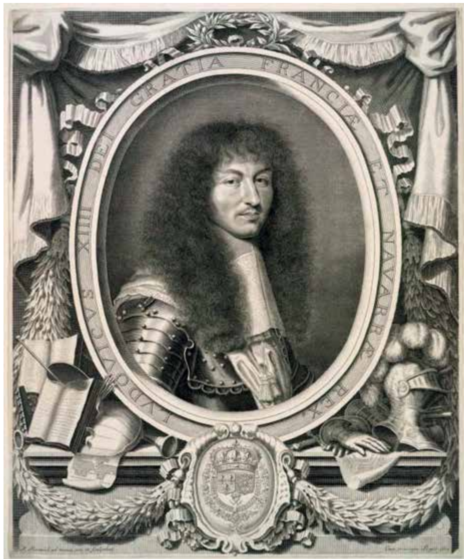
Retrato de Luis XIV, rey de Francia, 1663. Pintado y grabado por Robert Nanteuil. Grabado calcográfico, talla dulce (buril) 403 x 331 mm. Princeton University Library, Department of Rare Books and Special Collections, Graphic Arts, GC016 Robert Nanteuil Collection, GA 2005.01126.