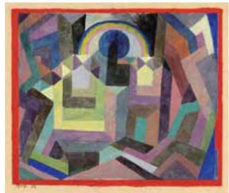
Con el arco iris, 1917

Paul Klee logra un manejo seguro del color relativamente tarde. Durante largo tiempo se dedicó de forma intensiva a la pintura sobre el dorso de cristales y a las acuarelas en negro. En numerosas acuarelas de la época de la Bauhaus encontramos gradaciones tonales con pares de colores complementarios. El estudio del orden de los colores también se detecta en los cuadros de cuadrados.