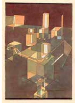
Ciudad italiana, 1928

En torno a 1930 llama la atención la aparición de muchas construcciones geométricas en los cuadros de Paul Klee. Están vinculadas con la configuración planimétrica y estereométrica que empezó a enseñar en la Bauhaus a partir de 1927. Hay algunos dibujos que son, en mayor o menor medida,