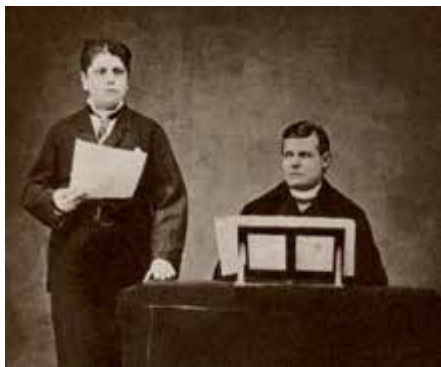
Alessandro Moreschi, l'angelo di Roma. El último castrato

Aguiló, viola da gamba y Sara Erro, clave), el miércoles 29.