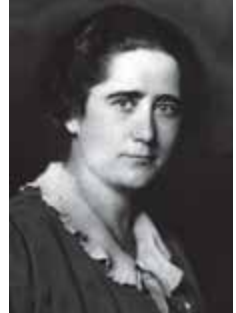
Alma Mahler, Virginia Woolf y Clara Campoamor

solamente una exquisita modernista, creadora de belleza en sus novelas y cuentos; es también una pensadora, cuyas reflexiones sobre el arte —la relación de la creación con las condiciones materiales, los límites de la representación, las mujeres como objeto y sujeto de la literatura...— están del todo vigentes. Al mismo tiempo, y ése es el otro motivo que explica su actualidad, Woolf es un icono muy poderoso (por su fama y su sólido prestigio), pero también ambiguo. ¿Escritora elitista o autora popular? ¿Defensora de la tradición o vanguardista? ¿Artista encerrada en su torre de marfil, o intelectual comprometida? ¿Casta esposa victoriana, u homosexual?... Ninguna de estas preguntas tiene una respuesta clara, lo que ha permitido a los más diversos grupos reivindicar a Woolf. Y así es como el exquisito jardín modernista en el que florecen obras tan refinadas como Al faro , Orlando o Las olas es también un fértil huerto que acoge textos robustos — El señor Bennett y la señora Brown , Una habitación propia , Tres guineas ...— y, a la vez, un campo de batalla en el que se afrontan muy distintas causas”.