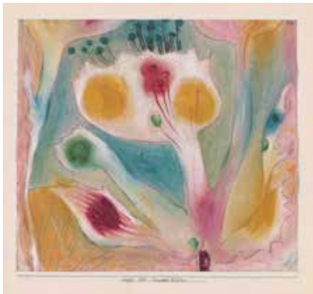
Flor tropical, 1920

Paul Klee convirtió muy pronto las leyes de la naturaleza en el fundamento de su quehacer artístico. Mientras que en las clases la naturaleza sirve como ejemplo ilustrativo de una configuración viva, en su actividad creadora le interesa también como motivo. Fascinado por la visión a través del microscopio crea cuadros con formas de tipo celular o tematiza incluso