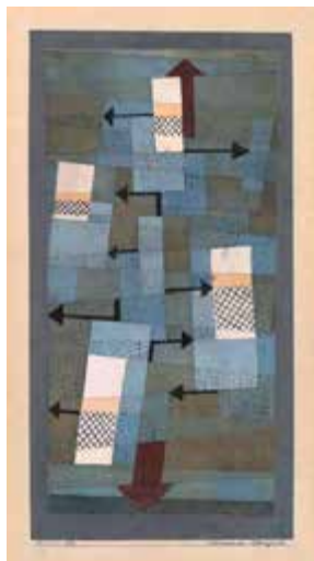
Equilibrio inestable, 1922

diferentes maneras. Por ejemplo, utiliza la flecha como símbolo del movimiento que tiene una dirección clara o expresa la dinámica mediante motivos giratorios.