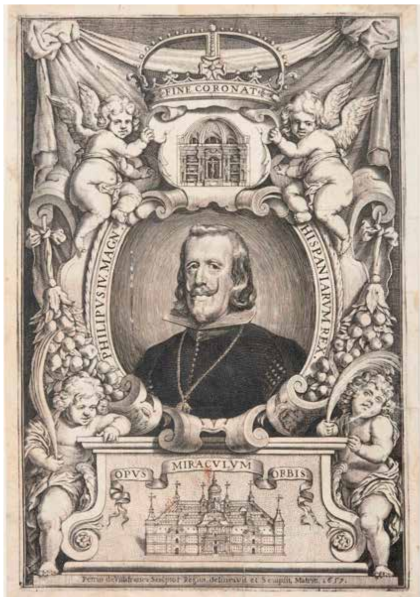
Retrato de Felipe IV, 1657, dibujado y grabado por Pedro de Villafrañca. Grabado calcográfico, aguafuerte y buril, 263 x 177 mm. Anteportada de la obra de Francisco de los Santos, Descripcion breve del Monasterio de S. Lorenzo el Real del Escorial... , Madrid, Imprenta Real, 1657. Biblioteca Nacional de España. ER/4723.