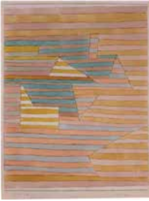
Oasis Ksr., 1929