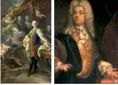
Farinelli y Senesino

ría a ser compositor. Para comprender la naturaleza excepcional de Farinelli vale la pena reproducir, de entre los numerosos testimonios que elogian sus dotes, el del historiador y músico Padre Giovanni Battista Martini, recogido por su primer biógrafo, Giovenale Sacchi ( Vita del Cavaliere Don Carlo Broschi , Venecia, 1784): “Dotado por la naturaleza de una voz agradable, dulce, fuerte, penetrante y amplia desde lo más grave has-