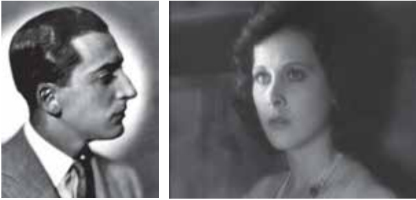
Gustav Machaty y la actriz Hedy Lamarr en un fotograma de Éxtasis

cuando el cine sonoro sonaba en Hollywood y en el centro de Europa lo que se empezaba a oír era ruido de botas y un presagio de mundo enmudecido. Éxtasis es, hoy, un recipiente único que contiene dos universos contradictorios, el de un cine mudo ya difunto y el de una de esas estrellas que lució ahí por primera vez y para siempre, Hedy Lamarr. Aunque el sello de ese pasaporte a la eternidad (de ella y de la película) lo estampa una escena nunca antes vista en una pantalla de cine comercial: la jovencísima actriz protagonista (todavía no era Hedy Lamarr, sino Hedwig Eva Maria Kiesler) corría completamente desnuda por el campo. Una escena larga, llena de una perfecta naturalidad y que prelude lo que es la esencia de