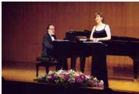
Los compositores Hanns Eisler y Arnold Schoenberg y los intérpretes del concierto