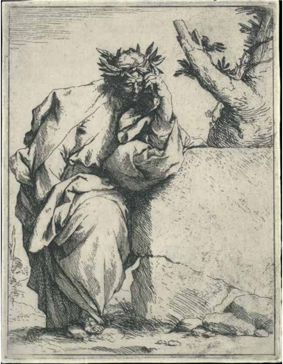
El poeta , c. 1620-1621. Inventado y grabado por Jusepe de Ribera Grabado calcográfico, aguafuerte. 162 x 125 mm.

Harris Brisbane Dick Fund, 1930 (30.54.69)