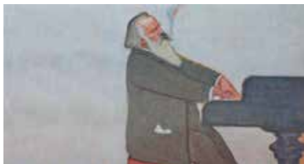
Brahms al piano. Dibujo de Willy von Beckerath (1896)