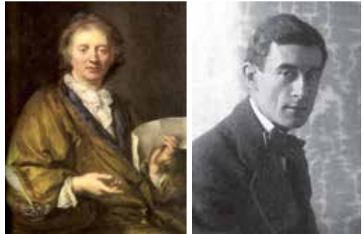
François Couperin y Maurice Ravel

Tras el resquebrajamiento de la tonalidad, sostén armónico durante más de tres siglos, y la progresiva disolución de las formas musicales convencionales, acentuada durante el final del Romanticismo, el compositor se enfrentaba a la imperiosa necesidad de encontrar un nuevo lenguaje musical. A esta misión se dedicaron con vehemencia las vanguardias históricas, que en su empeño por buscar nuevas estéticas acabaron legitimando la noción