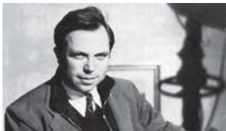
King Vidor y un fotograma de Y el mundo marcha