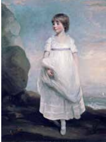
Meredith Frampton, Sir Ernest Gowers en el RCDCR de Londres, 1943 (Imperial War Museum, Londres) y John Hoppner, Anne Isabella Milbanke (posteriormente Lady Byron), c. 1800 (Ferens Art Gallery, Hull Museums)

ejemplo del código moral que lleva su nombre: concienzuda, cívica, diligente y piadosa.