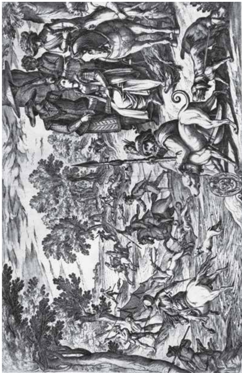
Antonio Tempesta, Dama observando una escena de caza , c. 1609

Grabado calcográfico, aguafuerte, 270 x 399 mm aprox.