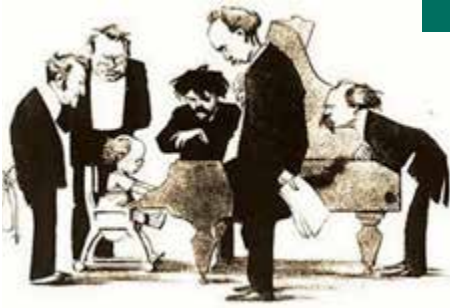
Caricatura del compositor E. W. Korngold al piano como niño prodigio, observado por Siegfried Wagner, Max Reger, Artur Nikisch, Richard Strauss y Eugen d'Albert (de izquierda a derecha)

to de inicio de la canción romántica de concierto como género musical autóctono. Gretchen am Spinnrade : quizá el texto más difundido, más representativo y más hondamente inscrito en el imaginario de la cultura germánica.