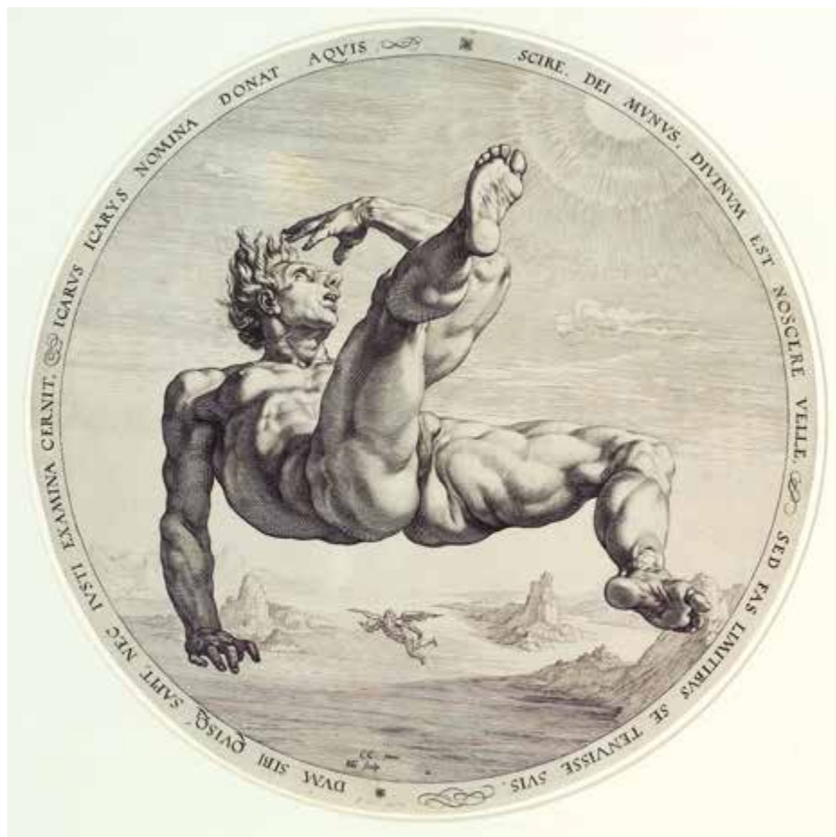
Ícaro , 1588. Grabado por Hendrick Goltzius, por invención de Cornelis Cornelisz van Haarlem Grabado calcográfico, buril. Diámetro: 335 mm. Print Collection, The Miriam and Ira D. Wallach Division of Art, Prints and Photographs. New York Public Library, Nueva York