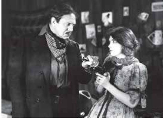
Dos fotogramas de El viento y Victor Sjöström

presentó a la actriz Lillian Gish en lucha contra el viento huracanado en las planicies de Texas, convirtiendo con ello de modo muy poético a la naturaleza en un agente dramático de la acción, según la tradición del cine nórdico.”