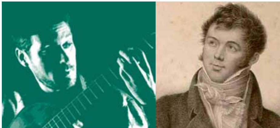
Carles Trepat y Fernando Sor

otras obras como Junto al Generalife del maestro valenciano, y Española (originalmente compuesta para piano pero arreglada con aprobación de su autora) de Rosa García Ascot, la única representante femenina de la Generación del 27, cuya figura está todavía pendiente de una valoración histórica más apropiada.