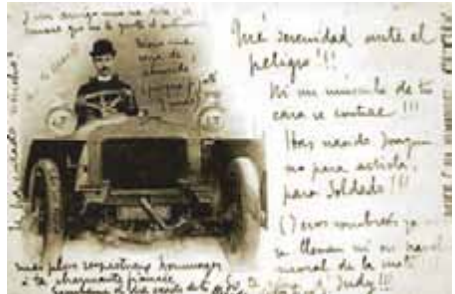
Postal enviada por Turina desde París en 1907.