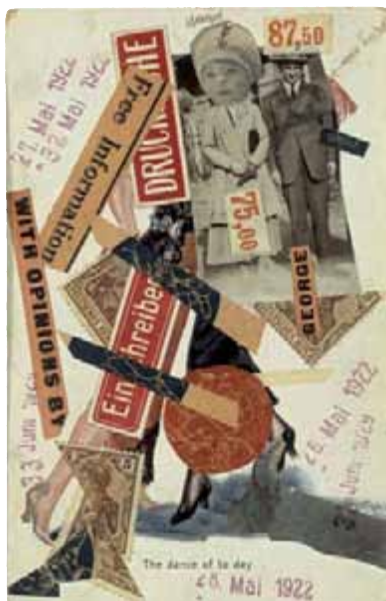
George Grosz, El baile de hoy , 1922

En manos de artistas como El Lissitzky (1890-1941), Aleksandr Ródchenko (1891-1956) o Gustavs Klucis (1895-1938), el fotomontaje se convirtió en la Rusia soviética en una poderosa herramienta política. Casi al mismo tiempo, en Alemania, artistas como Kurt Schwitters colocaban el fotocollage y el fotomontaje en el centro de su práctica artística, y otros como John Heartfield (1891-1968) o Max Burchartz (1887-