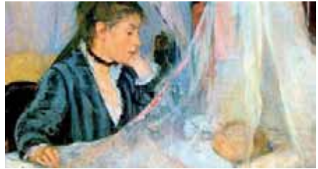
Le berceau , 1872, de Berthe Morisot (detalle). Musée d'Orsay, París

Cantar a un hijo para conciliar su sueño es uno de los ritos más arcaicos en todas las culturas, independientemente del papel que la música desempeñe en sus hábitos sociales. En esta constante histórica cabría situar el origen remoto e impreciso de las nanas o canciones de cuna, cuya tradición escrita solo es posible reconstruir durante los aproximadamente últimos tres siglos. No es seguramente casualidad que el surgimiento y consolidación de esta práctica compositiva hayan corrido paralelos a la emancipación del niño como personaje histórico y al de la infancia como sujeto creativo. Esto explicaría que fuera a partir de finales del siglo XVIII cuando este género comienza a adquirir protagonismo, en una continua exploración musical del mundo mágico del sueño, y de las sensaciones de tranquilidad y protección; pero también de abandono y pesadilla, imaginadas por los niños en el momento de dormir. Este programa propone una selección de nanas procedentes de tres culturas lingüísticas distintas: la germana representada por Schumann, la anglosajona por Britten y Copland, y la hispana por Rodrigo, Nin-Culmell, Guastavino y Ginastera.