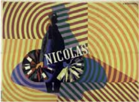
Cassandre (Adolphe Jean-Marie Mouron), Nicolas, 1935.