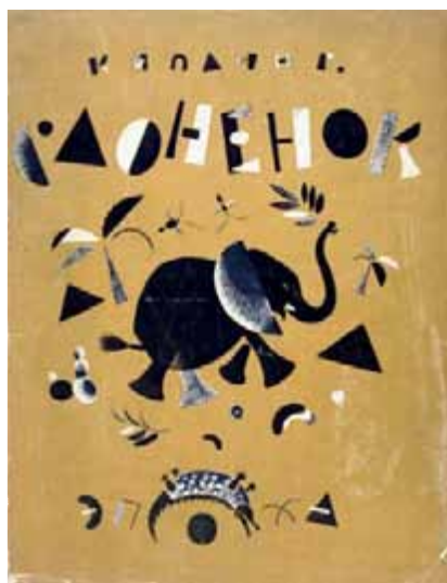
Sloniónok (El elefantito), 1922. Ilustración de Lébedev. Texto: R. Kipling V.

A la vista del casi completo desconocimiento de Lébedev más allá de las fronteras de la extinta Unión Soviética y de la carencia casi total de traducciones de textos y fuentes disponibles en español, inglés y en otras lenguas, el catálogo preparado para la muestra