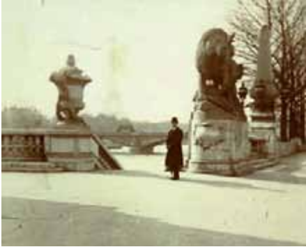
Joaquín Turina delante del río Sena, hacia 1913.

la capital francesa proporcionándole valiosos consejos artísticos, mientras que las enseñanzas de Vincent D'Indy en la Schola Cantorum fueron esenciales. Resultó también inevitable que el joven Turina absorbiera la enorme vitalidad creativa del París de esos años, una circunstancia reflejada en el ciclo a través de distintos autores, unos contemporáneos como Debussy, Satie o Ravel y otros de la generación anterior cuya obra seguía aún presente. La obra posiblemente de mayor envergadura de esta etapa, el Quinteto Op. 1 que inauguró oficialmente su catálogo, muestra de hecho un lejano eco de los quintetos de referencia entonces en París, los de César Franck y Johann Brahms.