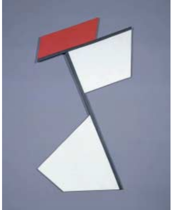
Lidy Prati, Concreto o Sin título , 1945. Colección particular

(Extracto de Osbel Suárez, La abstracción geométrica en Latinoamérica (1934-1973): viajes de ida y vuelta , catálogo de la exposición)