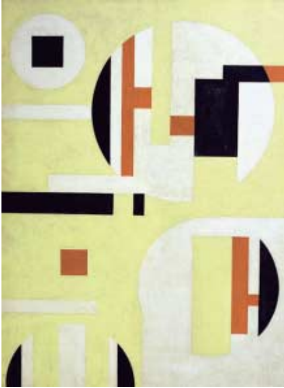
Sandú Darié, Multivisión espacial , 1955. Colección Museo Nacional de Bellas Artes, La Habana

métrica en Latinoamérica, mostrándola en su circunstancia de viaje de ida y vuelta, el de la influencia en los artistas abstractos de la tradición del viejo continente y el de la decisiva ruptura con esa tradición.