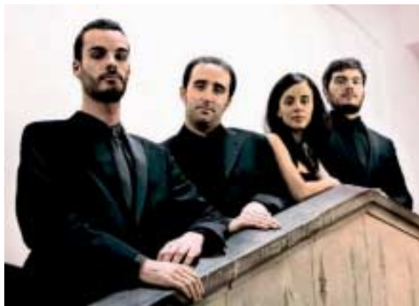
El grupo Qvinta essencia abre el ciclo de conciertos