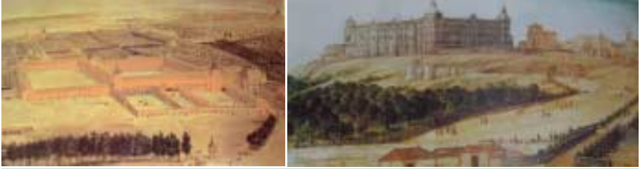
Jardines de El Buen Retiro y el Alcázar de Madrid, en el siglo XVII

del Toisón de Oro en 1621 y Capellán de los Reyes Nuevos de Toledo en 1624 (previa concesión de la “naturaleza castellana” en 1623). Obviamente, estos nombramientos tenían muchas veces un carácter honorario y el único fin de incrementar los ingresos y el prestigio social del beneficiario. Aparte de ello, su ordenación como sacerdote en 1605 le había permitido obtener “pensiones” con fondos de diversas diócesis o arquidiócesis: Pamplona (1611), Jaén (1621), Santiago de Compostela y las Canarias (1622) y Toledo (1623). Todo ello le permitió acumular un capital considerable.