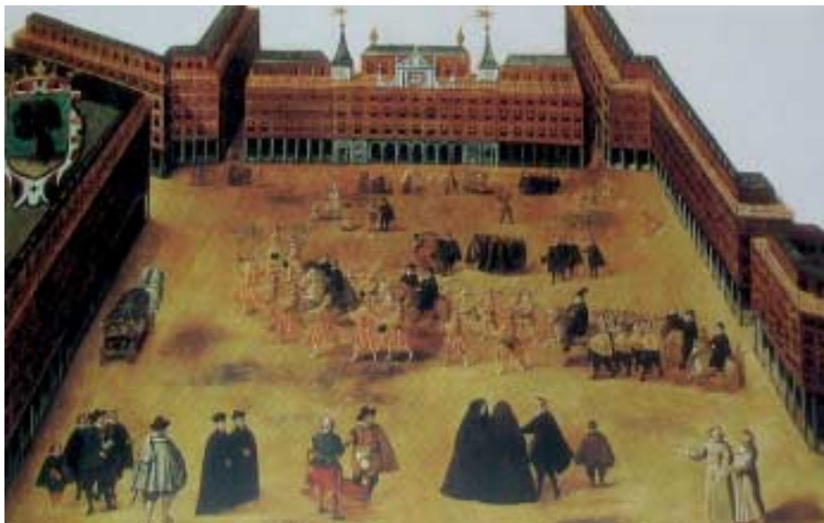
Plaza Mayor de Madrid en 1618

veces se me espeluznaban los cabellos de gozo, cuando mis compañeros y yo los cantábamos. En fin merecí por muchas razones el nombre de Capitán, dado éste cuando era niño.