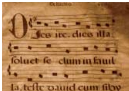
Secuencia Dies irae en canto llano. Monasterio de El Parral, Segovia. Libro de Coro del siglo XVII

El origen de la recreación en música de un sentimiento o idea extramusical se remonta a la teoría de los afectos del Barroco y tuvo en Julius Reubke un gran continuador romántico con su música programática para órgano. Las dos obras que abren y cierran el programa también tienen un vínculo claro con la muerte. En el caso de la Pieza heroica , parece verosímil creer que Franck tenía en mente la reciente guerra franco-prusiana que tanto reforzó las identidades nacionales de ambos países. Por su parte, las Fantasías corales de Reger, de 1900, son presentadas como una especie de escena en tres cuadros, en la que la última obra simboliza la redención final del género humano.