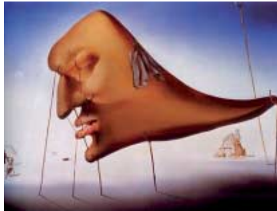
«El sueño», de Salvador Dalí

El autor explica en su libro que “el arte, la religión, la filosofía, la ciencia, la política, incluso la guerra, es decir, cualquier actividad humana se ve periódicamente influida por ciertos ‘mensajes’ oníricos plenos de sentido para el actor que los recibe en el escenario del sueño. Cabe preguntarse, si en ese abismo sin fondo del que brota el onirismo –esa oscura sima que nos separa del mundo de