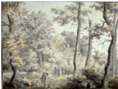
Casa de campo en el bosque, c. 1797. Galerie Hans, Hamburgo

una polémica con participación de varios artistas y escritores. En julio de 1810 realiza una larga excursión a pie por los Riesengebirge con el pintor Friedrich Georg Kersting, de la que surgirán varios óleos. Expone dos cuadros – Monje a la orilla del mar y Abadía en el robledal – en la Exposición de la Academia de Berlín, que serán adquiridos por el príncipe heredero Federico Guillermo de Prusia. En septiembre de ese año J. W. Goethe visita a Friedrich en Dresde y el 12 de noviembre éste es nombrado miembro externo de la Real Academia de Berlín.