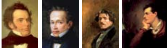
De izquierda a derecha, F. Schubert, G. Leopardi, E. Delacroix y Lord Byron

El propósito de este curso es analizar el movimiento romántico en el ámbito de las diferentes formas de creación estética, como la literatura, la filosofía, la pintura y la música. Se buscará tener una visión de sus características particulares en los diferentes escenarios geográficos que abarca su desarrollo, centrándose en autores fundamentales como Leopardi, Delacroix, Schubert, Lord Byron o Espronceda. Se analizará además el romanticismo entendido como un territorio de ideas, una forma de ser, de vivir o de sentir, así como las características particulares del desarrollo de este movimiento en España.