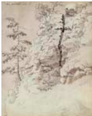
Roquedo con árboles, 1799. Staatliche Museen zu Berlin, Kupferstichkabinett, Berlín

Las obras expuestas son de diversas técnicas –lápiz, gouaches y acuarelas– y en estados que van desde los bocetos y estudios realizados al aire libre durante sus viajes, hasta algunas obras «finales», agrupadas todas según los motivos y temáticas más recurrentes en la obra del artista: edificaciones y arquitecturas, ruinas, árboles, plantas y los más variados paisajes. Los préstamos proceden de los más importantes museos estatales de Alemania y el norte de Europa, así como de algunos coleccionistas de todo el mundo cuyas obras nunca o muy raramente han sido expuestas. El proyecto se ha llevado a ca-