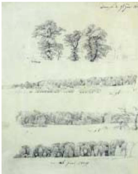
Estudios de árbol, 1809. Kunsthalle Bremen-Kupferstichkabinett-Der Kuntsverein in Bremen

Dibujados en cuadernos o en hojas sueltas, a lápiz o pluma, durante largas sesiones de trabajo o durante sus viajes, al hacerlos Friedrich no tenía en mente una pintura definida; de modo que, estrictamente, no se trata de dibujos «preparatorios». Más bien son fragmentos dibujados de la naturaleza, de la misma naturaleza que el artista «leía» como un libro escrito por Dios el día de la Creación, una convicción sin la que, como escribe Helmut