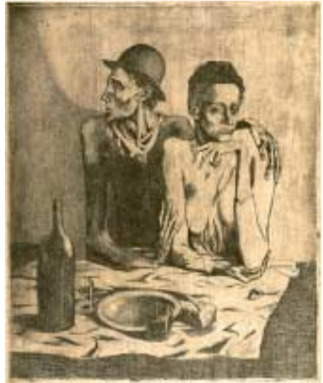
La comida frugal, 1904

Pablo Picasso (Málaga, 1881 - Mougins, 1973) concedió siempre enorme importancia a su producción gráfica. Prueba de ello es que desde 1899 hasta 1972 trabajó ininterrumpidamente este género artístico, llegando a realizar alrededor de 2.200 grabados, que constituyen casi un diario per-