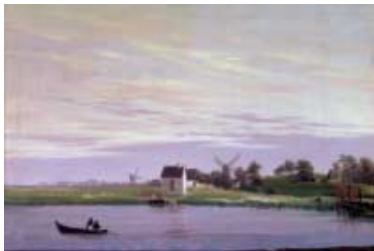
En el Ryck en Greifswald con una vista de los molinos frente a la presa de Steinbeck, c. 1822-1823.