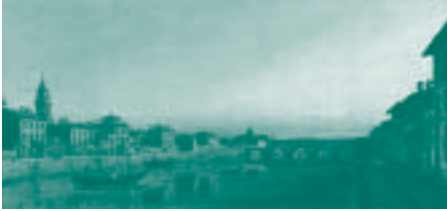
El río Arno y el puente Carraia, Florencia, c. 1745

obras son: la expansión del estilo recitativo, el cifrado del bajo instrumental conocido como «bajo continuo», mayor énfasis en la recreación musical de las emociones expresadas por el texto poético, una mayor demanda técnica con pasajes virtuosísticos, un sentido más dramático de la música y, por último, predominio de las relaciones armónicas que prefiguran un cierto sentido tonal (en detrimento de las relaciones contrapuntísticas y la modalidad de la etapa anterior).