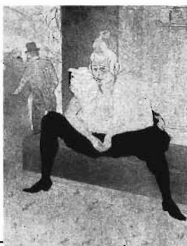
«Elles: La Clownesse sentada», 1896

Cincuenta y tres obras de Toulouse-Lautrec se exhiben en la Fundación Juan March desde el 15 de octubre.