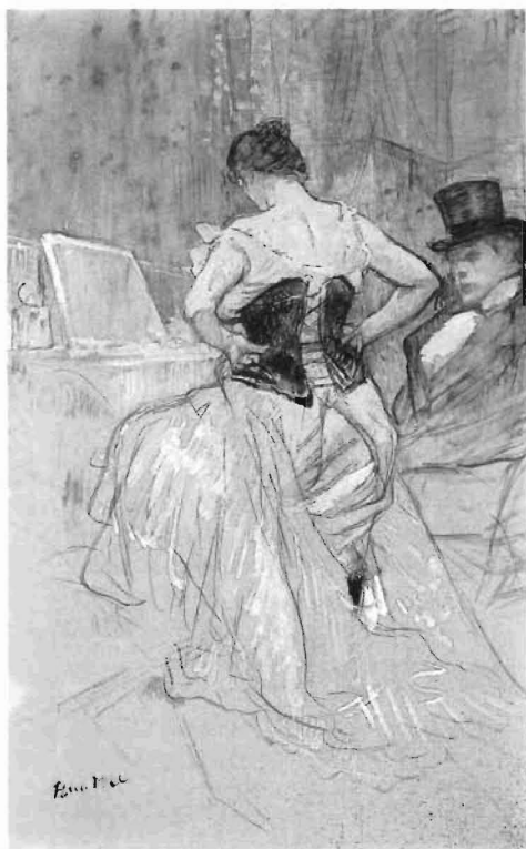
«Estudio para Elles : Mujer en corsé», c. 1896

de su figura, quedó inmunizado contra las burlas, lo que le permitió criticar la vulgaridad de los demás sin permitirse la más mínima compasión hacia sí mismo.