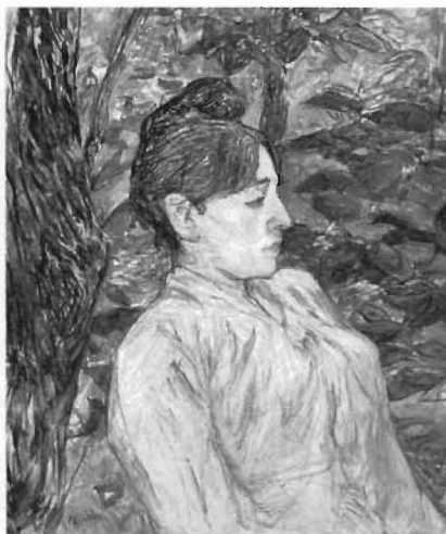
«Bajo el verdor», 1890-91