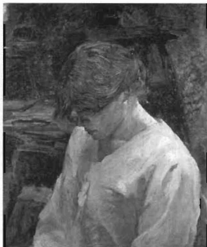
«La pelirroja con blusa blanca», 1889