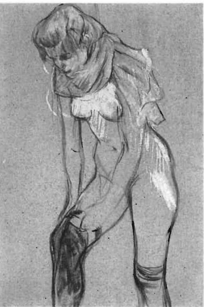
«Mujer quitándose las medias», 1894

La selección de obras expuestas arranca con algunas de los años de formación del pintor, bajo la influencia del impresionismo y del divisionismo, o de la moda del japonismo. Así, ejercicios de taller como «Estudio de desnudo. Mujer sentada en un diván» o «El joven Routy en Céleyran» (ambos, de 1882); el retrato de su madre, «La condesa A. de Toulouse-Lautrec en el salón del Castillo de Malromé» (1887), entre otros cuadros. Siguen obras con los temas más populares de Lautrec: los