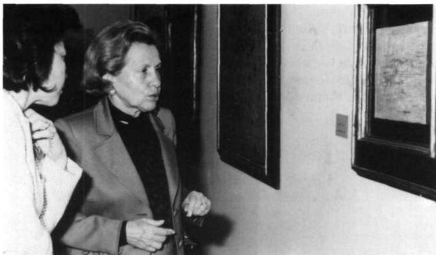
El 7 de junio, la esposa del Presidente de Portugal, Maria de Jesús Barroso, visitó la exposición Vieira da Silva en la Fundación Juan March.