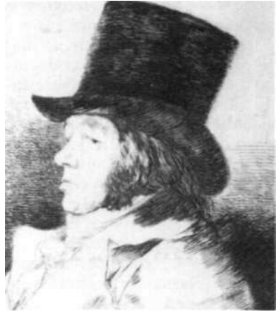
«Autorretrato» de Goya.

DURANTE TODO el mes de mayo seguirá abierta en la Villa Vauban-Galerie d'Art Municipale de Luxemburgo la exposición de 218 grabados de Goya , pertenecientes a las cuatro series de Caprichos , Desastres de la guerra , Tauromaquia y Disparates o Proverbios , que se presenta en esta capital en colaboración con la Ville de Luxembourg-Administration Communale. La exposición, inaugurada el pasado 17 de abril, estará abierta hasta el 3 de junio próximo.