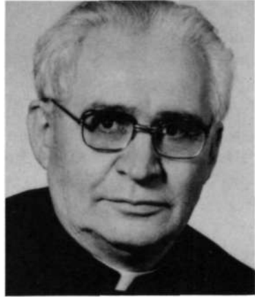
Por José López-Calo

Dum vixi divina laus mihi unica cura; Post obitum sit mihi divina laus unica merces. (Mientras viví las alabanzas divinas fueron mi único cuidado; Ojalá que después de mi muerte sean las alabanzas divinas mi único premio). (Dístico anónimo del siglo XVIII escrito en un cantoral polifónico de la catedral de Burgos, probablemente por un cantor de la catedral).