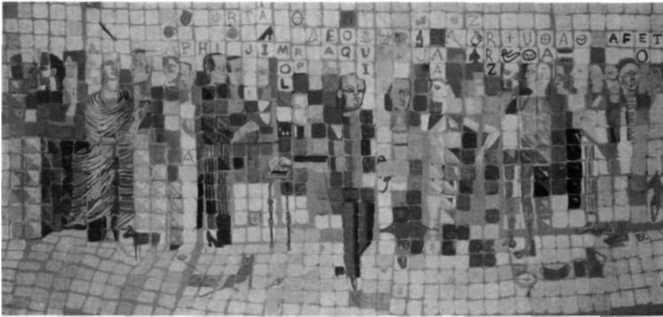
«El metro», 1942 (gouache).

Complementariamente, en su obra, la evidencia bidimensional de superficies, la conciencia del cuadro-objeto, se desdobra hacia horizontes visuales de insospechada profundidad. En constante ambigüedad, el color es utilizado en continuo dualismo transparencia-densidad, mientras que la línea evidencia unas veces planos y estructuras ortogonales, y otras, se transmuta en nervaduras caligráficas que borran las formas con manchas evanescentes, con filamentos etéreos y resplandecientes,