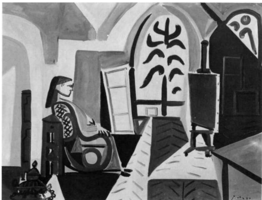
«El estudio», 1956.

En Las Meninas , como en los Talleres , Picasso recoge en la amplia estancia del palacio de los Austrias el reducto de trabajo del pintor, de igual modo que lo hace en su taller de «La Californie». La asistencia y colaboración de Jacqueline durante la gestación y el desarrollo del conjunto de Las Meninas las pone de manifiesto el propio Picasso con el espléndido retrato que le dedica al fi-