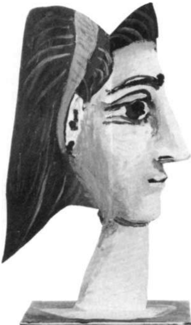
«Jacqueline con cinta amarilla», 1962.

de Jacqueline coincide con una intensificación de su constante preocupación por abordar un mismo tema desde diversas ópticas. Ello supone que la riqueza de su creatividad no centra su labor únicamente en una técnica, sino que un mismo tema es desarrollado y analizado hasta el práctico agotamiento de toda respuesta posible. Pinturas, dibujos, maquetas, esculturas, cerámica y obra gráfica presentan una interrelación temática que, a la vez que confiere una unidad a la obra del artista de este momento, no impide que cada una de las opciones plásticas mantenga su individualidad con respecto a las demás y se convierta, además, en un nuevo punto de partida para otras, lo que dará lugar a un interminable proceso creativo.