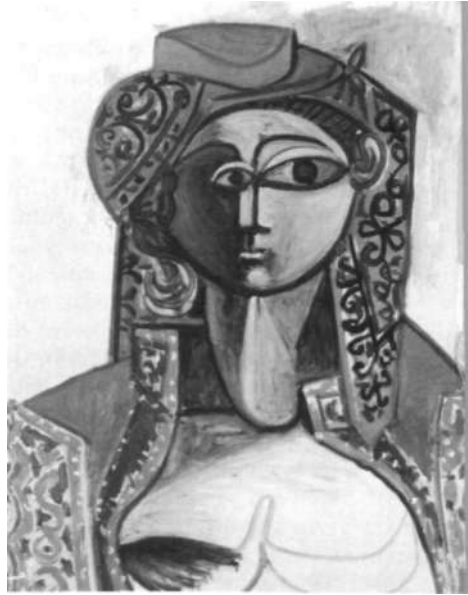
«Jacqueline con vestido turco», 1955.

La constante inquietud de Picasso por la búsqueda de nuevas formas de expresión —«la peinture est plus forte que moi, elle me fait faire ce qu'elle veut»— le hará irrumpir, dando la mano a Jacqueline, en Les femmes d'Alger , de Delacroix, entre noviembre y diciembre de 1954, a partir de la semejanza existente en-