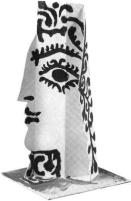
«La española», 1960-61.