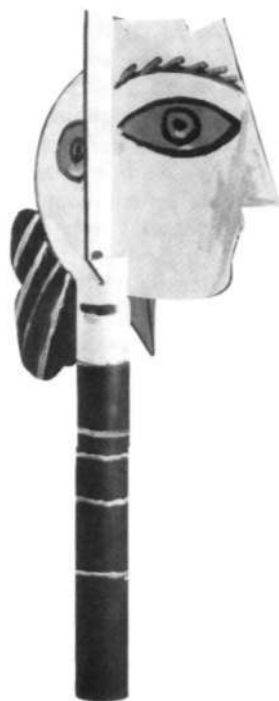
«Cabeza de mujer». 1957.

También la actividad plástica adquiere nuevas formas de expresión en esta última época. La presencia