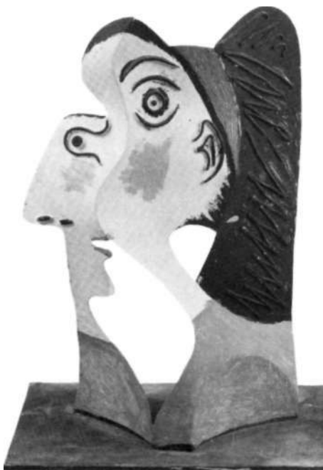
«Cabeza de mujer», 1962.