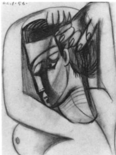
Album de dibujos de 1956.

bustos femeninos. La descomposición y reconstrucción de la figura femenina es objeto de un exhaustivo discurso analítico que va desde una serie de mujeres sentadas en un sillón, pasando por la serie de Jacqueline y jovencitas , hasta las cabezas con sombrero —sombrero que aparece iconográficamente representado por vez primera en Les Déjeuners —, en las que la legibilidad literal de Jacqueline se pierde una vez más para remitirnos a aspectos referenciales de su rostro en los que la mirada escrutante sobresale en todas las paráfrasis que configuran este tema. La escultura Mujer con sombrero no cierra dicho proceso ni constituye la solución final al tema de la mujer con sombrero sentada que espontáneamente tendrá un desarrollo posterior no sólo en pintura, dibujo y escultura, sino también en obra grabada. La legibilidad de los rasgos faciales de Jacqueline es mucho más evidente en las esculturas como Jacqueline y Jacqueline con cinta amarilla , de 1962, directamente entroncadas con dos óleos del 19 de febrero de 1960 y que reemprenderá en una se-