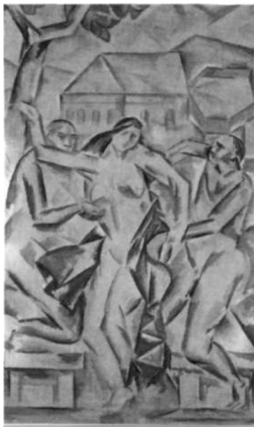
«Figuras abrazándose», 1913-14, de Guifreund