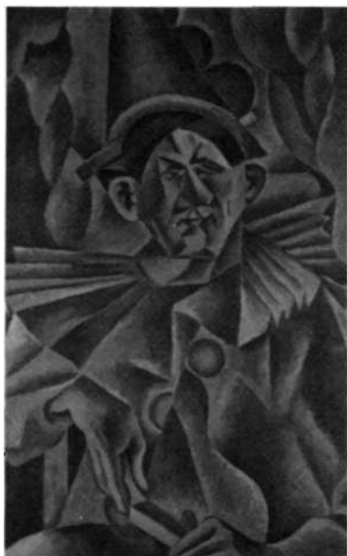
«Pierrot», 1911, de Kubista