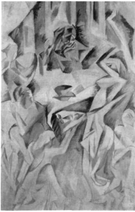
«Salomé», 1911-12, de Filla