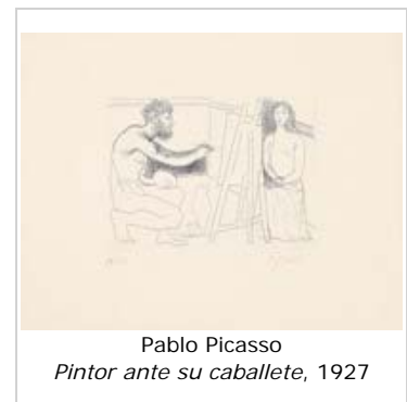
Pablo Picasso Pintor ante su caballete , 1927

Muestra integrada por los trece aguafuertes originales realizados por Pablo Picasso en 1931 para el relato del escritor francés, Le Chef d'oeuvre inconnu , por