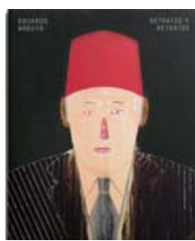
Eduardo Arroyo. Retratos y retratos

Ediciones española e inglesa Madrid, 2013