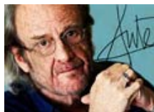
Luis Eduardo Aute 13 diciembre Vídeo