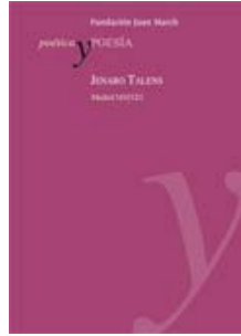
Poética y Poesía Jenaro Talens Madrid, 2013