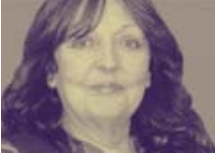
Cristina Fernández Cubas

En una primera sesión, un novelista da una conferencia sobre su propia "poética", cómo concibe su trabajo y cuál es su relación con el acto creador. En otra sesión, el escritor mantiene un diálogo con un crítico o buen conocedor de su obra, para finalizar con la lectura, por parte del novelista, de un texto suyo inédito.