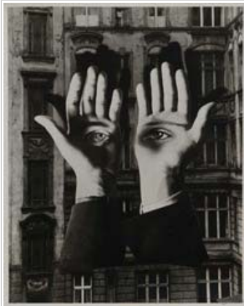
Herbert Bayer Urbanita solitario , 1932