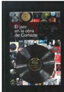
El jazz en la obra de Julio Cortázar