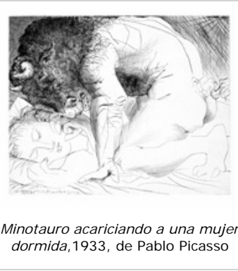
Minotauro acariciando a una mujer dormida , 1933, de Pablo Picasso

Exposición de pequeño formato, articulada en torno a una pieza central: La Minotauromachie (1935), obra principal de la producción gráfica de Picasso perteneciente a la colección de la Fundación Juan March. Se exhiben 15 grabados de la Suite Vollard dedicados a la figura del minotauro.