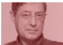
Félix de Azúa