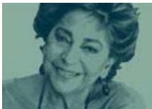
Teresa Berganza 17 mayo