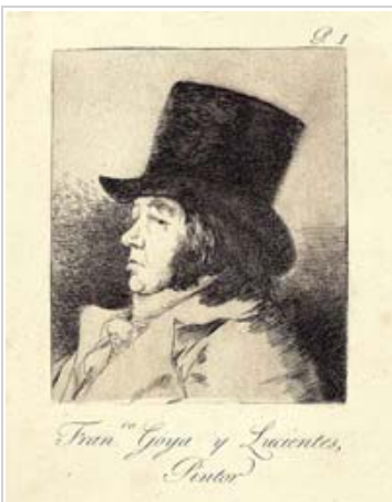
Francisco de Goya Autorretrato , 1927-31