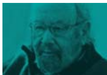
José Manuel Caballero Bonald