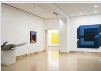
Vista de una de las salas

Colección de 59 abanicos decorados por 59 artistas, en la que están representados todos los "ismos" y tendencias artísticas en España desde finales de los años 40 hasta los 70. La muestra incluye también una selección de obra gráfica de los artistas representados.