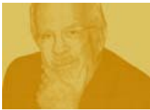
Antonio Fraguas "Forges" 11 enero

En 2013 prosiguió el nuevo formato de conferencias "Conversaciones en la Fundación": en una sesión mensual, los viernes, el periodista Antonio San José entrevista a destacadas personalidades de la cultura y la sociedad. El periodista pide al invitado que enuncie tres propuestas que, a su juicio, podrían contribuir a mejorar la sociedad. El diálogo se complementa con la proyección de imágenes y vídeos relacionados con la actividad del invitado. Seis sesiones se celebraron a lo largo del año: