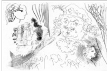
Pablo Picasso Rembrandt y cabezas de mujeres , París, 27 enero 1934

procedentes de los fondos de la colección de la colección de la Fundación Juan March y de una colección particular.