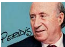
José María Pérez, "Peridis" 15 noviembre