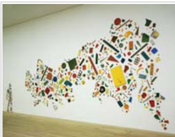
Tony Cragg Gran Bretaña vista desde el Norte , 1981