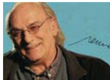
Carlos Saura 11 octubre