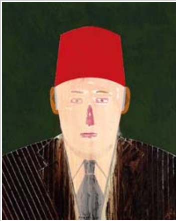
Eduardo Arroyo Autorretrato , 2011