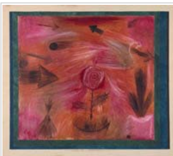
Paul Klee Viento de la rosa , 1922

renombrados de entre los que hicieron de la equivocadamente denominada "naturaleza muerta" uno de los géneros más característicos de la pintura del norte de Europa.