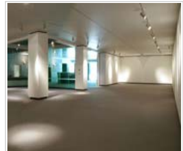
Vista parcial de la sala de exposiciones de la Fundación Juan March, en Madrid

En los Museos de Cuenca y de Palma se presentaron durante 2013 las exposiciones Goya: Caprichos y Disparates (en Cuenca); Pablo Picasso y "La obra maestra desconocida" de Honoré de Balzac (en Palma); Eduardo Arroyo: retratos y retratos (en Palma y Cuenca); Picasso grabador (1904-1935) (en Cuenca); Picasso grabados. La "Suite Vollard": a la manera de Rembrandt (en Palma); 59 abanicos de 59 artistas (en Cuenca); " La Minotauromachie " (1935); Picasso en su laberinto (en Palma); y La colección expuesta (I). Nuevas incorporaciones (en Palma).