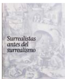
Surrealistas antes del surrealismo. La fantasía y lo fantástico en la estampa, el dibujo y la fotografía

Ediciones española e inglesa Madrid, 2013