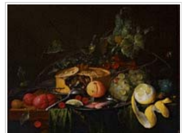
Jan Davidsz de Heem Bodegón con frutas y empanada , 1651

Pequeña muestra de 11 bodegones flamencos y holandeses, realizados en el siglo XVII por algunos de los artistas más