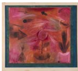
Paul Klee: maestro de la Bauhaus

Ediciones española e inglesa (con versiones para e-book)