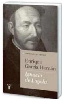
Españoles eminentes Ignacio de Loyola