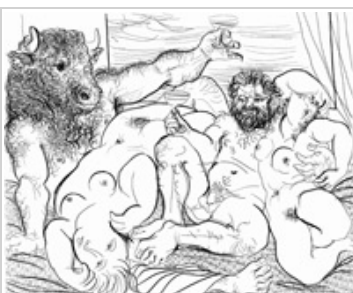
Pablo Picasso Escena báquica con minotauro , 1933

La Minotauromachie (1935): Picasso en su laberinto Museu Fundación Juan March, Palma