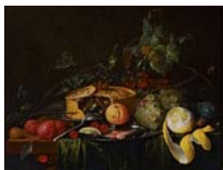
De la vida doméstica. Bodegones flamencos y holandeses del siglo XVII

Asimismo, siguió editándose y enviándose por e-mail, junto con el calendario mensual de actividades, el Boletín electrónico Noticias y propuestas de la Fundación , en formato HTML, con enlaces directos a la información correspondiente en la página web. Además de este Boletín electrónico, que informa sobre todas las actividades de la Fundación, en 2013 se editaron y enviaron por correo electrónico Boletines electrónicos de Música y de Conferencias .