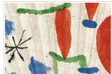
Joan Miró Madera; gouache sobre tela sobre contrachapado y cartón

El Museu reordena su colección. En esta primera edición, expone en torno a una treintena de nuevas obras, incorporando a figuras muy significativas de las últimas décadas, a la vez que aumenta la representación de otros artistas ya expuestos.