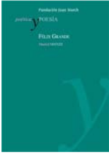
Poética y Poesía Félix Grande Madrid, 2013