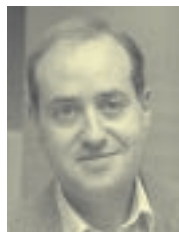
Carles Boix University of Chicago 27 de octubre