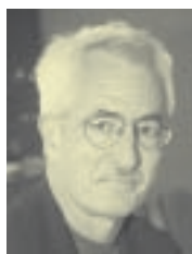
John Ferejohn Stanford University 25 y 26 de marzo

El contenido de los seminarios y de otros trabajos realizados en el Centro se recoge resumido en la colección de Estudios/Working Papers , que pueden ser consultados en Internet: www.march.es