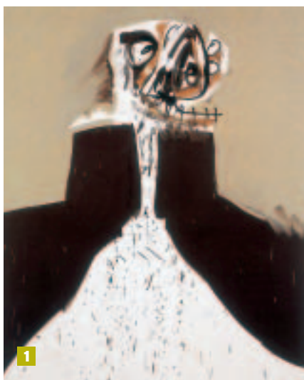
1. Géraldine dans son fauteuil, 1967, de Antonio Saura.- 2. Marrón y Ocre, 1959, de Antoni Tàpies