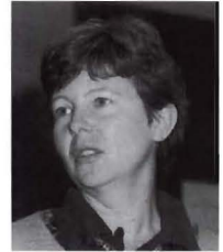
Donatella Della Porta

Finalmente, la conferenciante presentó y desarrolló un tercer modelo teórico, que está muy emparentado con el anterior, «pero tiene –dijo– ciertas peculiaridades que le conceden carácter propio. Este modelo enfatiza el carácter colectivo de los actores implicados en las relaciones de intercambio en que se da la corrupción, así como la relevancia de las relaciones de trust entre los agentes, la circulación de información entre los agentes que participan en la relación de corrupción, y las características del sistema de partidos políticos». Della Porta aplicó este tercer modelo teórico al caso italiano.