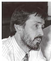
Jonas G. Pontusson.

Jonas G. Pontusson , Associate Professor en la Universidad de Cornell (Estados Unidos), habló en el Centro, el 6 de octubre, sobre la importancia del estudio comparativo de las estructuras económicas de los países europeos. Se refirió al auge y al declive de la socialdemocracia europea y a su relación con la estructura del empleo y la organización industrial de los países de la Europa occidental. Contradecía así a la literatura sobre el declive de la socialdemocracia que rechaza la relación entre la pérdida de apoyo electoral de estos partidos y, por ejemplo, el descenso en el número de trabajadores manuales. A su juicio, la no correlación entre ambos declives puede explicarse en algunos casos por la intervención de otros factores. Así, por ejemplo, señaló cómo en los países escandinavos la socialdemocracia se ha mantenido en auge en gran medida por el aumento del sector público.