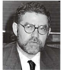
Joseph H. H. Weiler.

so de integración europea. Examinó las relaciones con los poderes judiciales nacionales de los Estados miembros, los gobiernos y parlamentos nacionales y la comunidad académica. Weiler planteó algunos cambios habidos, como el Acta Unica Europea (AUE) y el Tratado de la Unión (TUE), «que han afectado decisivamente al contexto en que se mueve el TJCE y a la relación con sus interlocutores. En primer lugar, la relación con las jurisdicciones nacionales puede volverse más compleja y más tensa. Problemas como la sobrecarga de casos y el retraso, el problema de los límites de la competencia comunitaria y cierta tendencia a su expansión pueden hacer que los tribunales nacionales, especialmente los constitucionales, tomen a su cargo el poner freno al expansionismo legislativo de Bruselas. También se produce un cambio en la relación con los órganos políticos nacionales.»