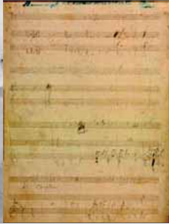
Bolero Opus 30 para violín y piano (ca. 1885). Partitura autógrafa

cuatro composiciones numeradas, así como algunos esbozos y algunas piezas incompletas y sin número, y comprende tres géneros principales: obras basadas en melodías originales o pastiches folclóricos, ya sean españoles o de otros países; fantasías/obras basadas en temas operísticos; y piezas de salón originales. Transcripciones, cadencias de concierto y piezas misceláneas completan su producción, cuya importancia radica en su potencial para el entretenimiento y el lucimiento y su accesibilidad para los oyentes de clases diferentes y de gustos musicales diversos.