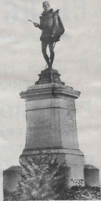
LA ESTATUA DE CERVANTES EN ALCALÁ

Cervantes, ya, de imaginación despierta, sigue su inspiración feliz á través de madrigales y romances, de los que la mayor parte no han alcanzado nuestros días. Sus amores con doña Catalina Palácio Salazar y Vozmediano, le pusieron en trance de batirse, matando á su contrario. Sin duda de este episodio de su vida, tomó el asunto de su comedia El gallardo español .