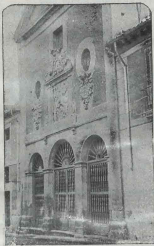
CONVENTO DE LAS TRINITARIAS acudía aquel mismo día á otro más solemne acom-