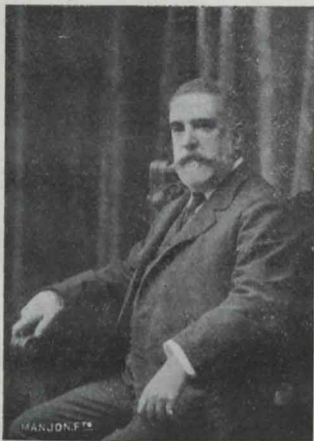
M. RAMOS CARRIÓN

CAPÍTULO XII de la segunda parte de la novela, en el que se refiere la extraña aventura que le sucedió al valeroso Don Quijote con el bravo caballero de los Espejos.