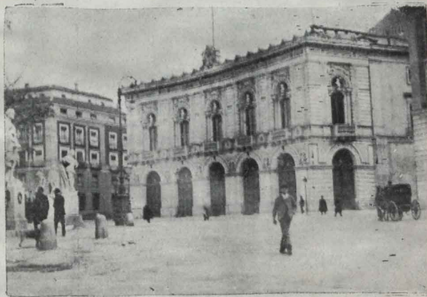
EDIFICIO DEL TEATRO REAL

En los teatros del Príncipe y la Cruz se ofrecieron también representaciones de ópera italiana en la época á que venimos haciendo referencia, y, por último, el teatro del Circo, á partir de 1842, sirvió para dar á conocer en Madrid artistas que luego fueron gala y ornato del moderno teatro Real.