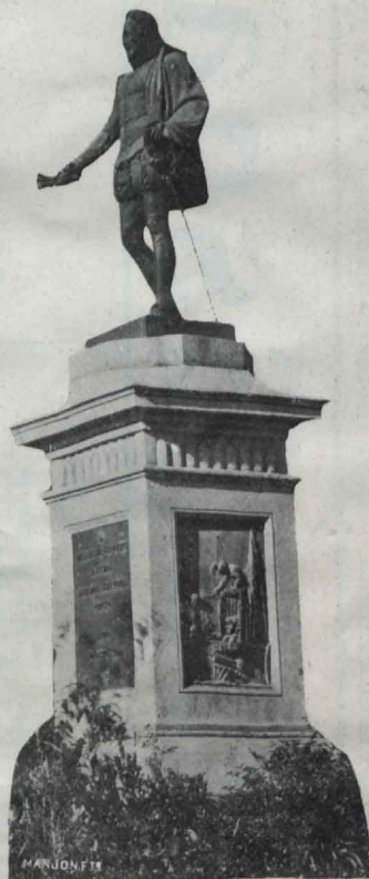
ESTATUA DE CERVANTES EN MADRID

Por un achaque, frecuente en nuestras cosas públicas, está colocada la estatua de Cervantes frente á la Cámara popular, y la de la Reina Gobernadora D.ª Cristina de Borbón, frente al bello edificio de la Academia de la Lengua.