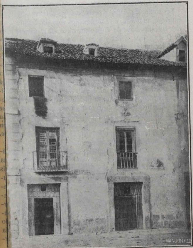
CASA QUE HABITÓ CERVANTES EN VALLADOLID

Publica La Galatea y escribe algunos entremeses y comedias, en número de treinta, que fueron bien acogidas por el público y celebradas por los comediantes, aunque los rendimientos no fuesen muy grandes. Sin duda, por esto, y porque ya sus necesidades fueron mayores al contraer matrimonio