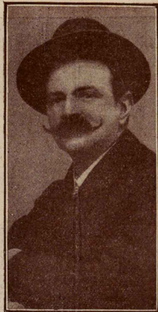
El poeta Fernández Shaw Autor del libreto.

El jueves último, y con éxito extraordinario, se estrenó en el teatro Magic-Park la leyenda lírica en un acto y un cuadro, El rayo de Luna , obra de Gustavo Adolfo Bécquer, letra del llorado poeta Carlos Fernández