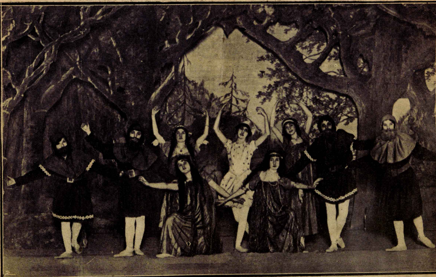
ESTRENO EN EL MAGIG-PARK. UN BAILABLE DE LA OPERA DEL MAESTRO ANGLADA, LETRA DEL MALOGRADO POETA CARLOS FERNANDEZ SHAW, "EL RAYO DE LUNA".